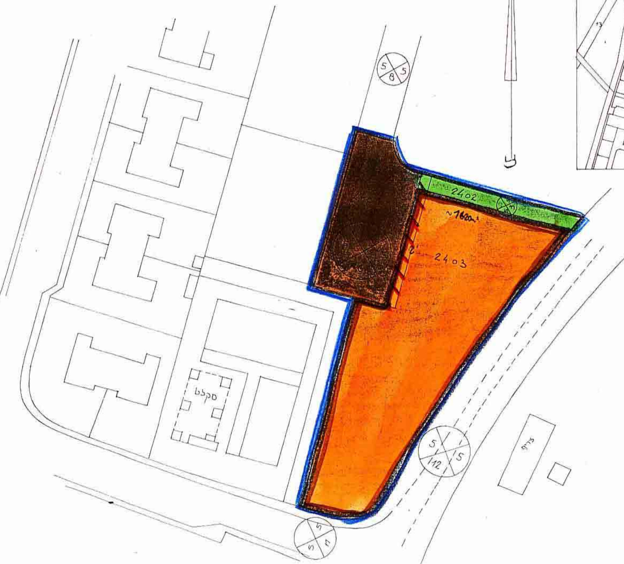
מצב מוצע ק"מ 1:500