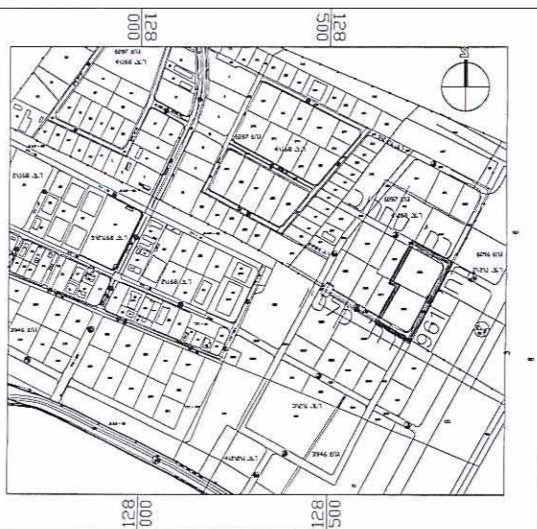
תרשים סביבה 1:10,000

אגף התכנון והנדסה מחלקת תכנון 18-09-1994 נתקבל נוספר