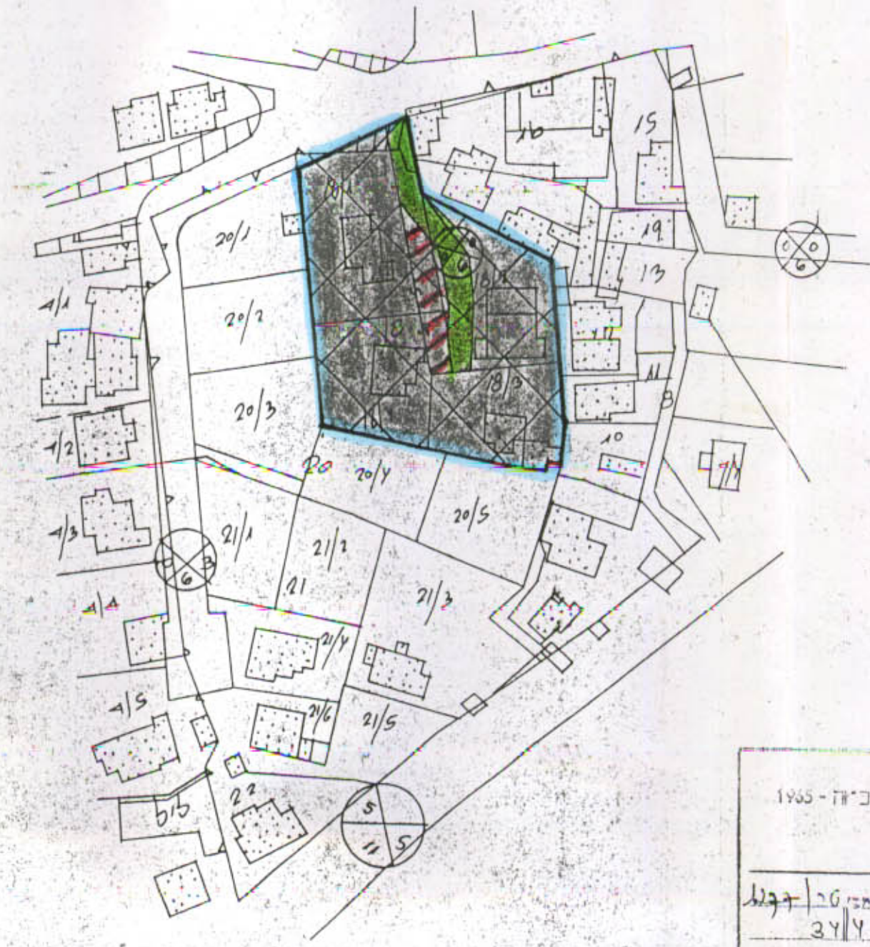
קרלים מצב חדש

משרד תכנון חוק התכנון והבניה תשכ"ה-1965 מחוז ג' רמת מרחב תכנון מקומי תכנית מס' 1277/76 הועדה המקומית לתכנון ובניה מיום 29.5.78 החליטה לתת תוקף לתכנית הנכבדת לעיל. סגן מנהל מרחב תכנון יושב ראש הועדה