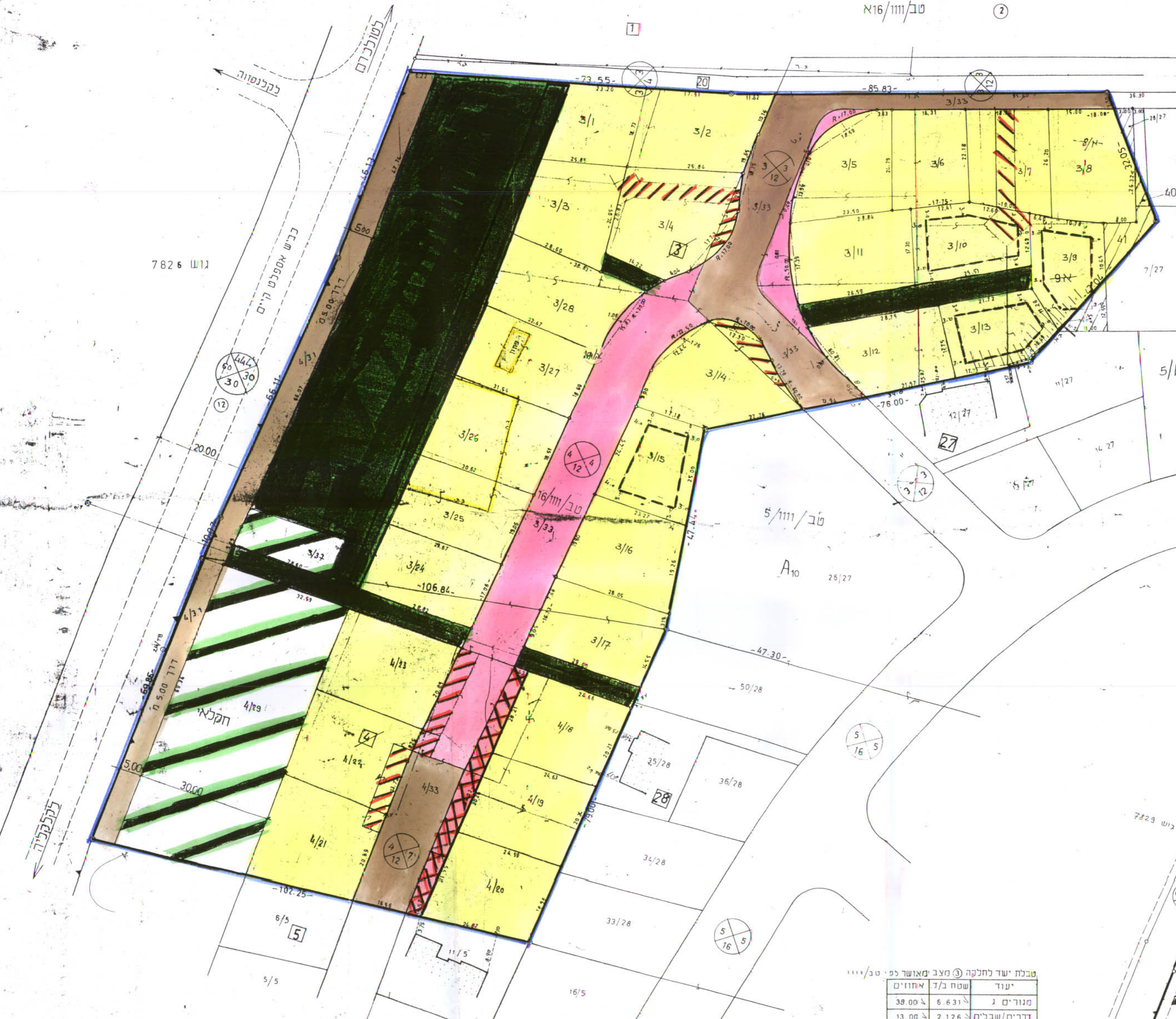
תרשים מצב מוצע קנ"מ 1:500