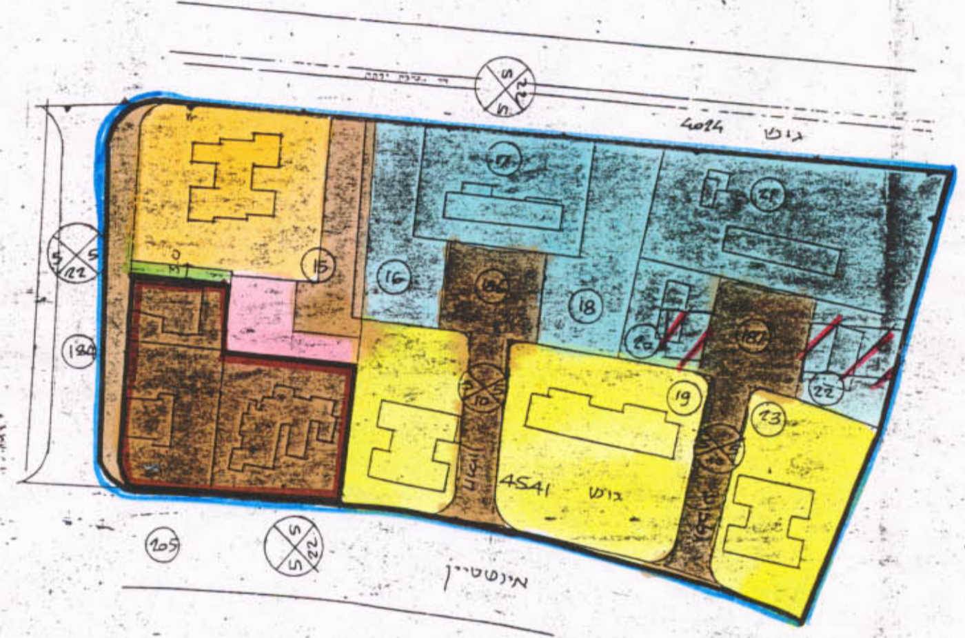
מצג מיתכנן 1:1250