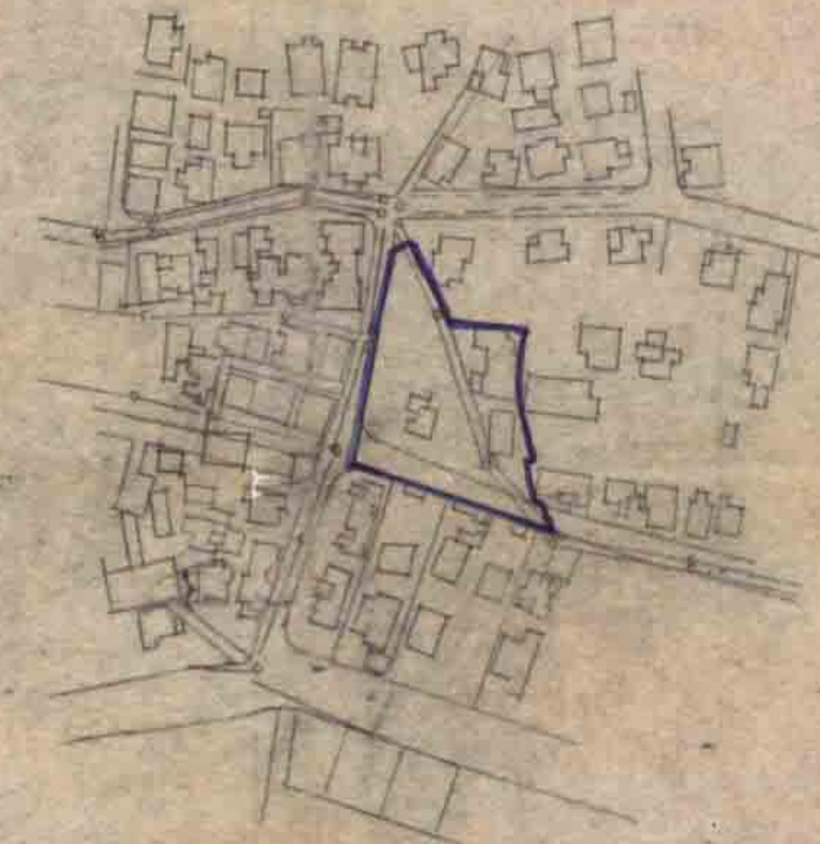
תרשים הסביבה קבו-2500