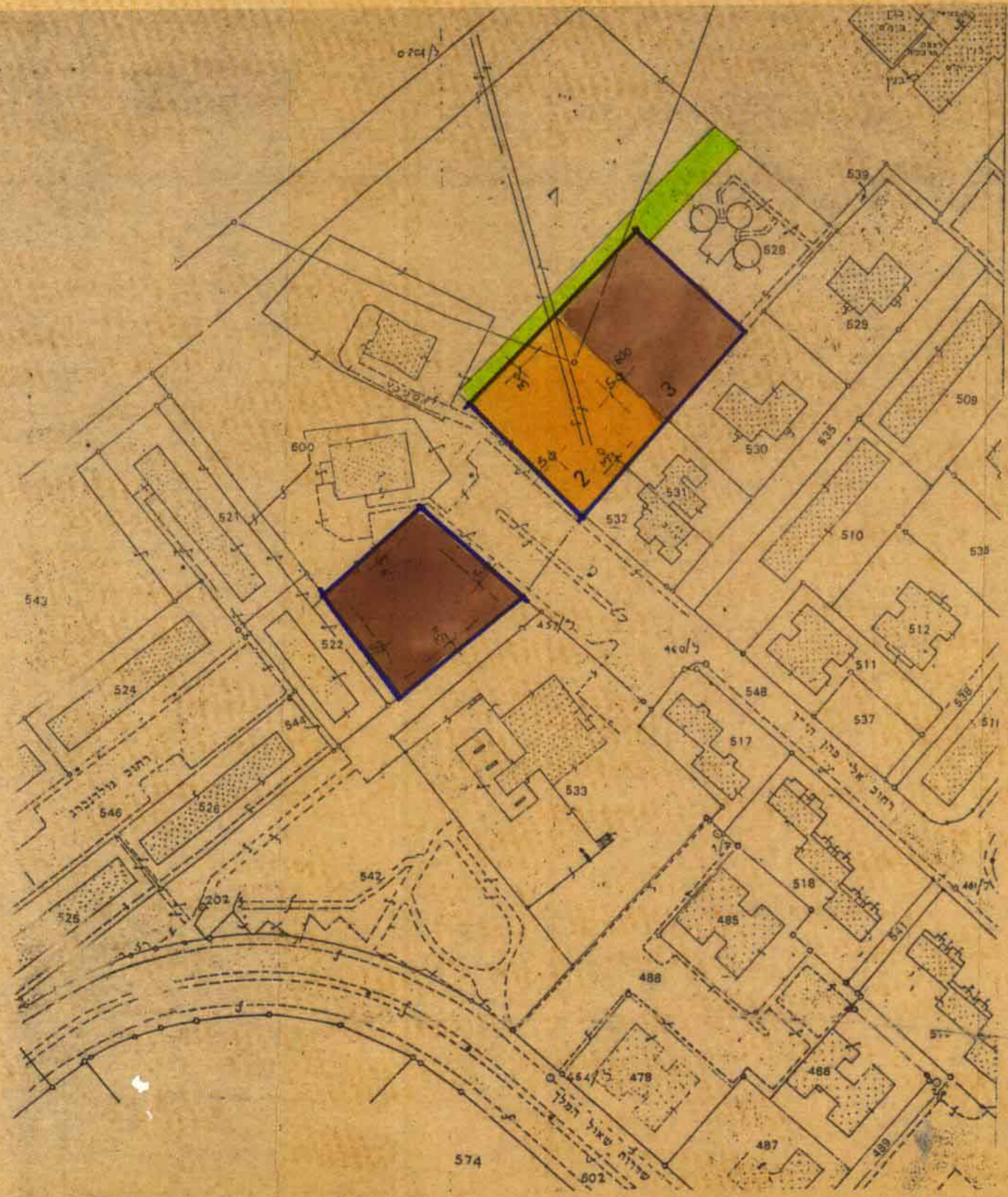
מצב מוצע 1:1250