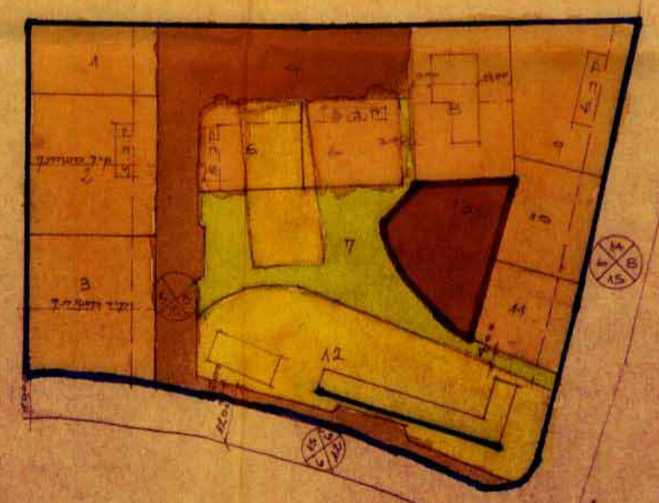
תרשים מודגשים 1:1250 מצב חדש