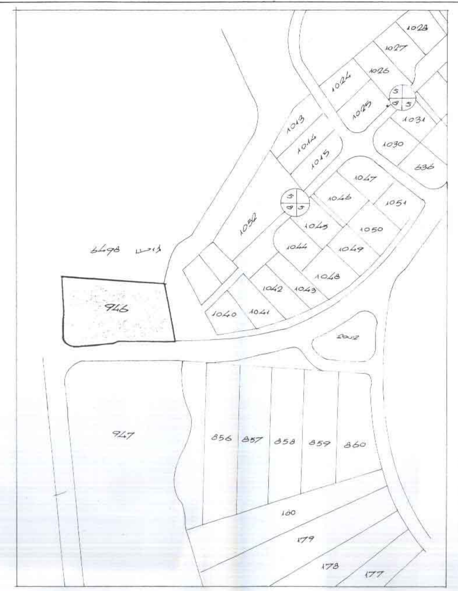
חרשים הסביבה 1:2500

ערוז : הערכז טועצה : טועצה אגורית טפעלות אפק גוש : 6498 חלקה 946 היוזם ועגיש התכנית : חברה אפדיקה-ישורל להשקעות בע"מ, א"א, אאד העס 13 בעל הקרקע : פינהל עקרקע ישורל עורך התכנית : נפתלי פורצייג, אדריכל, חברה לארכיטקטורה פוקצינלית בע"מ, ה"א, ביה ארון 5 תאריך 14.3.1971 : ק.מ. 1:500 שטח התכנית : בערך - 12000 מ"ר