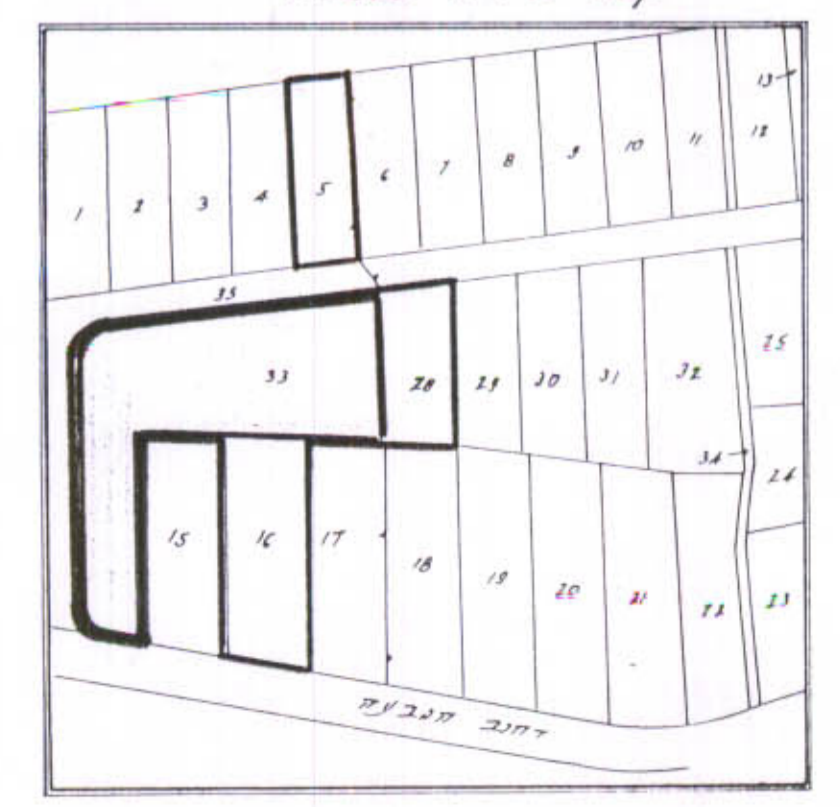
תלשים סביבה ומצב קיים קנה מידה 1:2500