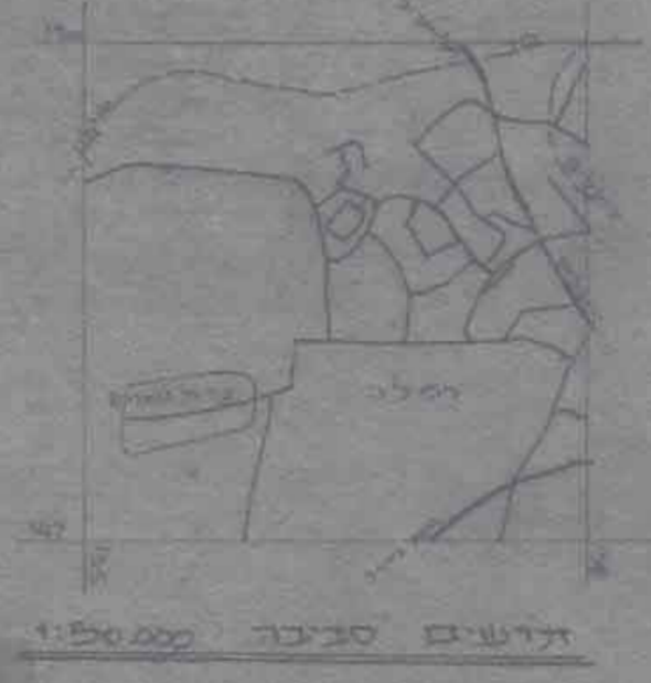
טבלת שטחים לתכנית מפורטת לה/292/א