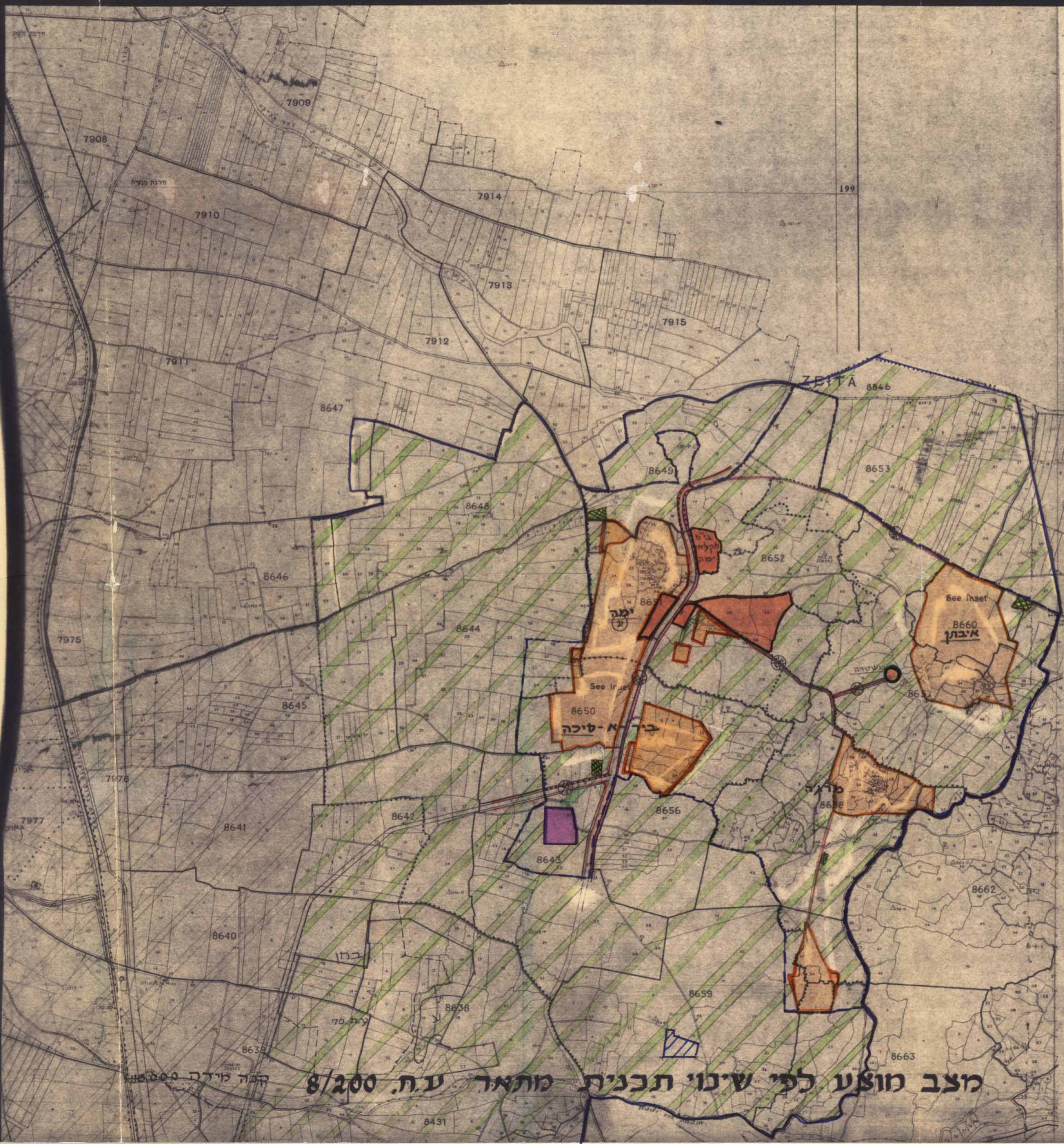
מצב מוצע לפי שינוי תכנית מתאר ע.ח. 200/8

חוק התכנון והבניה חס"ח - 1965 ועדה מקומית לתכנון ולבניה עמק חפר מס' תכ. 81/2000 מס' תכ. 81/2000 מס' תכ. 81/2000 מס' תכ. 81/2000