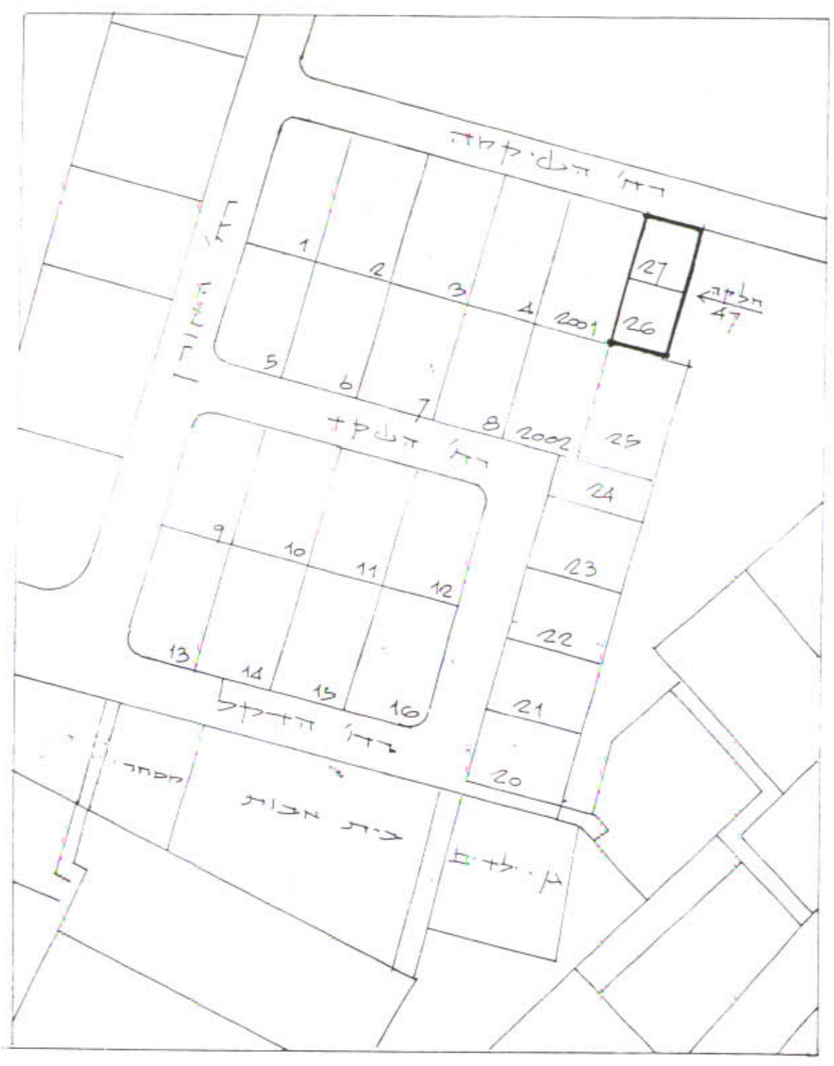
חדשים הסניכה 1:250