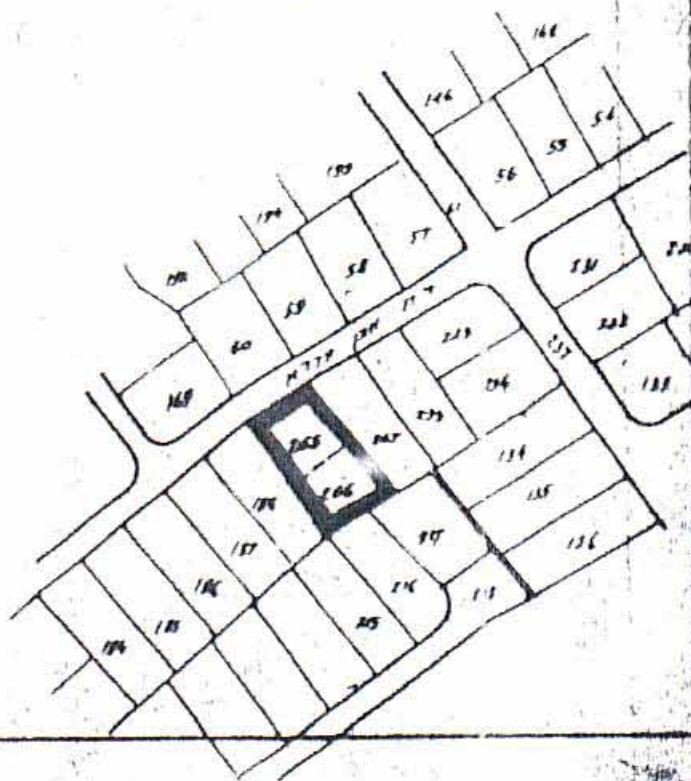
תרשים הסביבה 1:2500