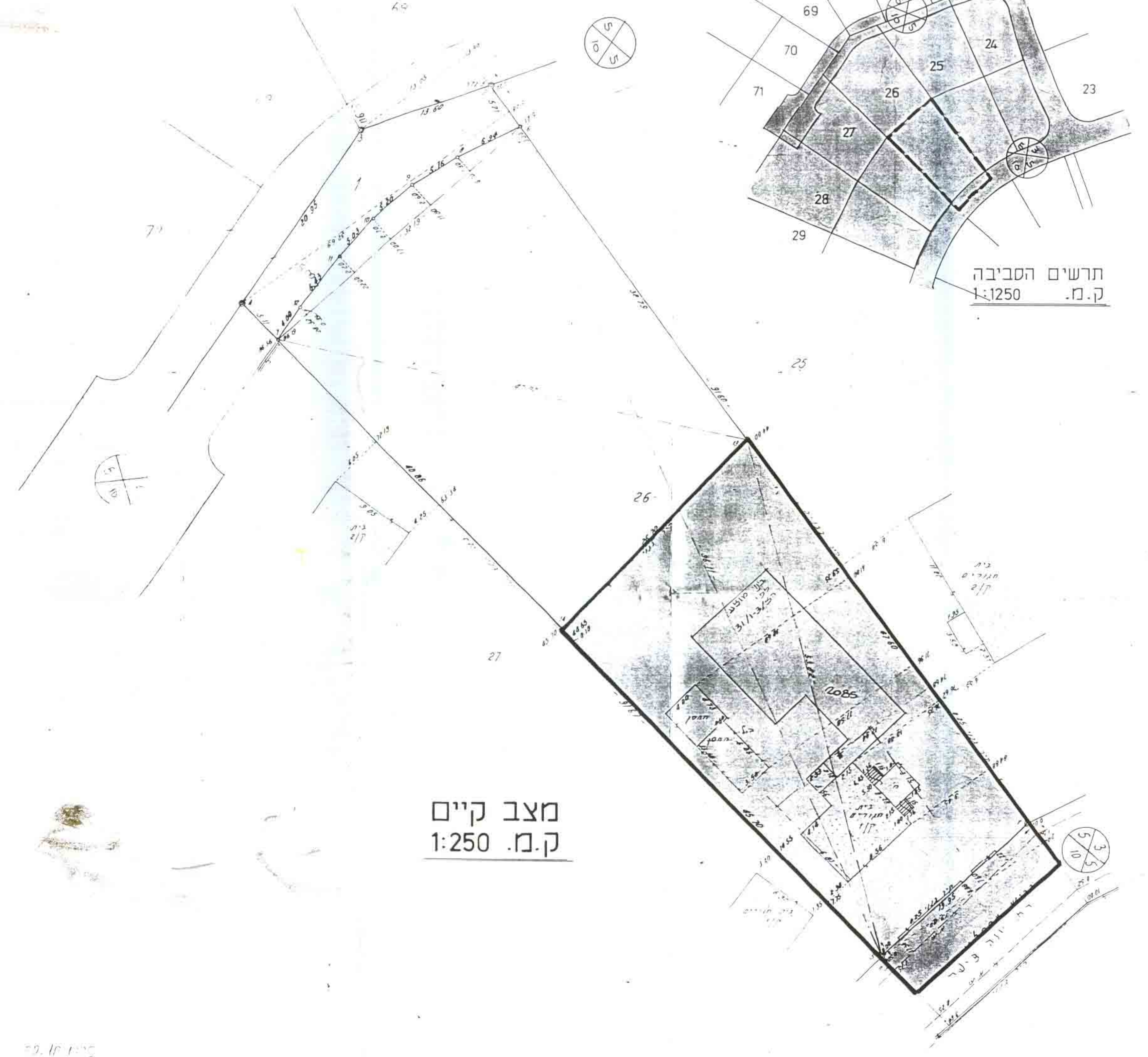
מצב קיים ק.מ. 1:250

מס' סדרי 7.945/80/3.2 מס' חלקה 26 מס' מגרש 2560 מס' יח' דיוור 2 מס' חלקה 26 מס' מגרש 2560 מס' יח' דיוור 2 מס' חלקה 26 מס' מגרש 2560 מס' יח' דיוור 2