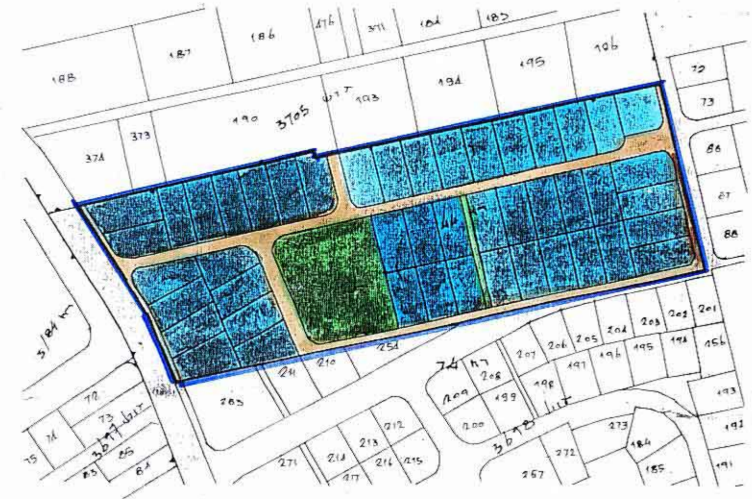
מלב קיים 1:2500

חוק התכנון והבניה חשביה-1965 הועדה המקומית לתכנון ולבניה מס' תכנית: 44/א מס' חלקה: 3698 מס' חלקה: 7 מס' חלקה: 47,203