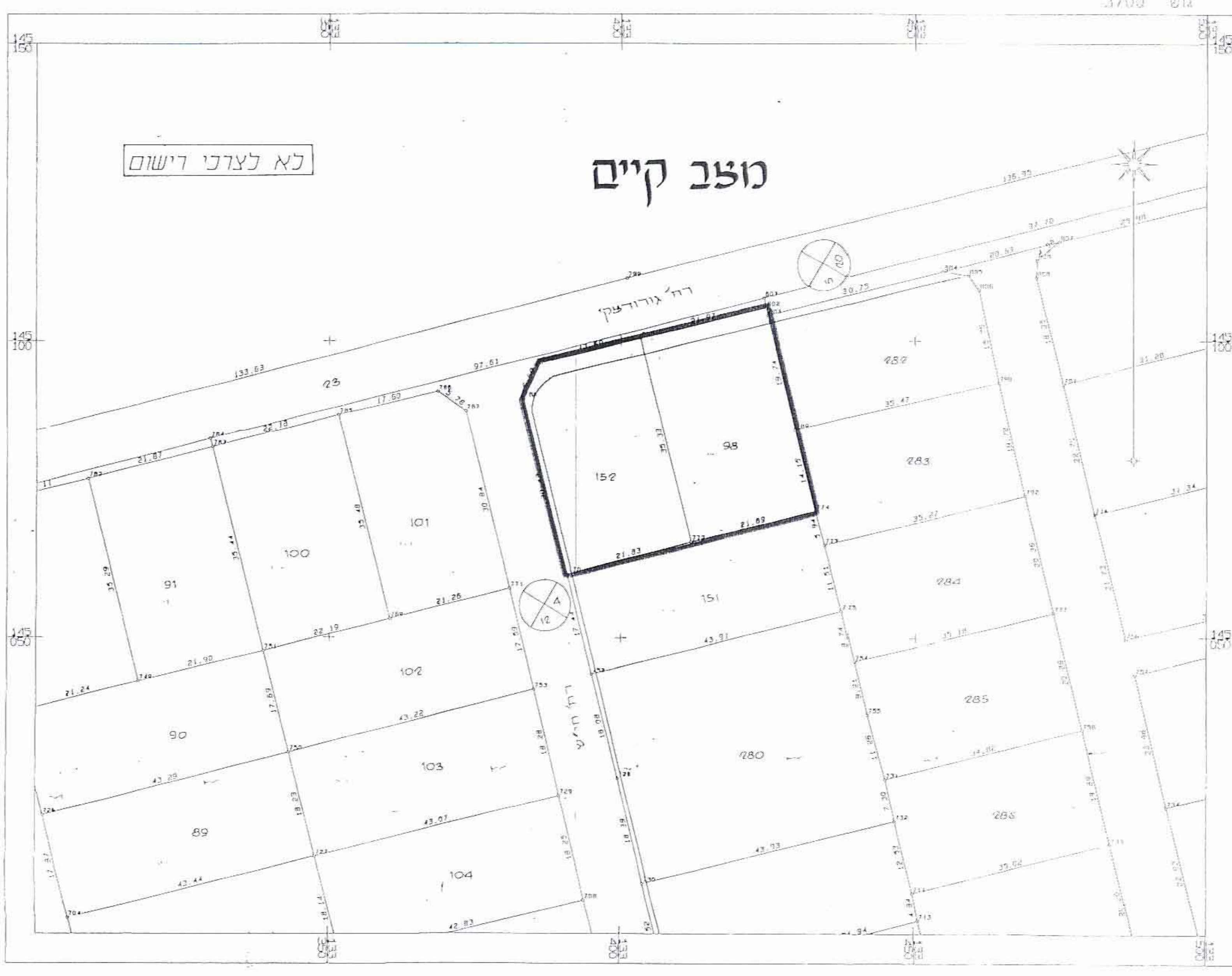
שטח 37000 יבטג בד'יטפיה מספוט של הרבנז כמפ'י ישראיל בקמ' 2500, הרחוטם מחושב'ם בככד ולא סמ'יות ערה קנה מידה 1:500 סכנולונית ותיי' ו'י'ם רצ'ת'גו י'ו'ו'י'ם