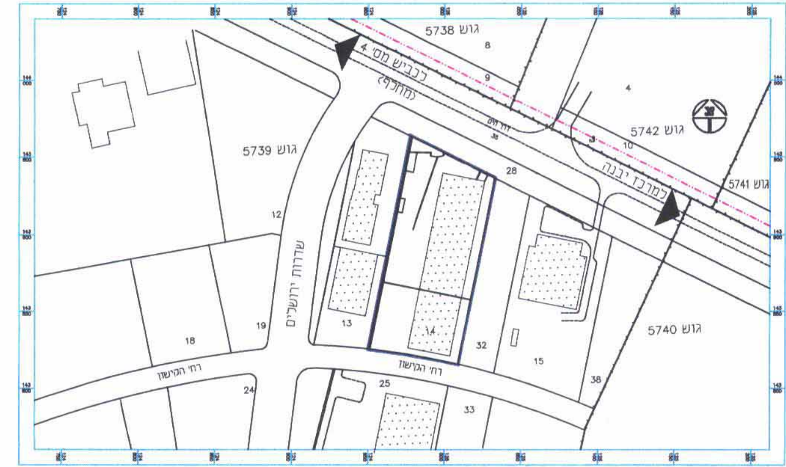
תכנית סביבה 1:2500