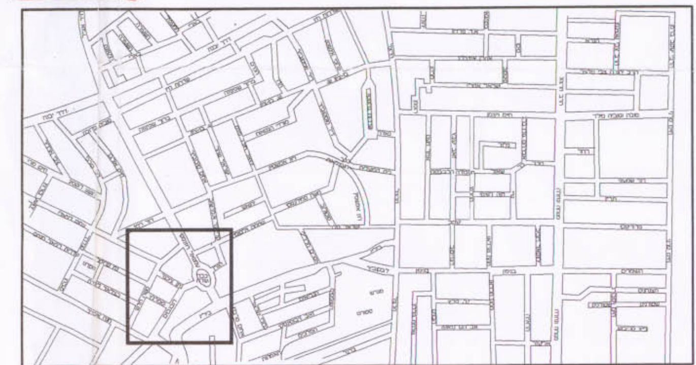
תרשים סביבה ק.מ. 1:12500