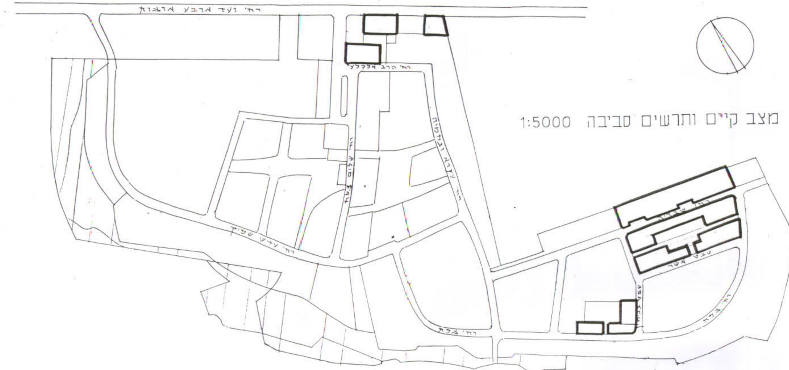
מצב קיים ותרשים סביבה 1:5000