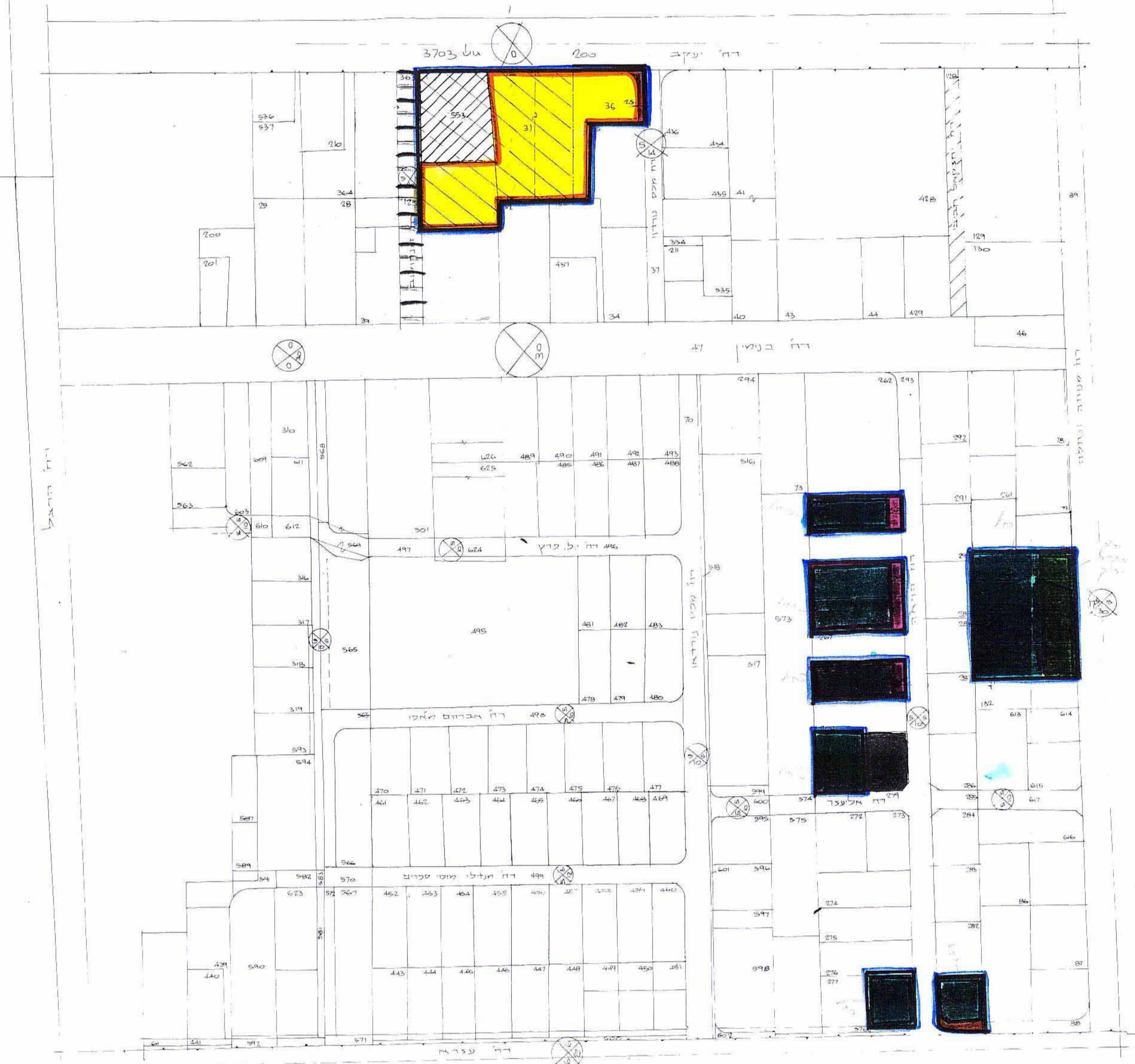
מצב מוצע ק"מ 1:1250