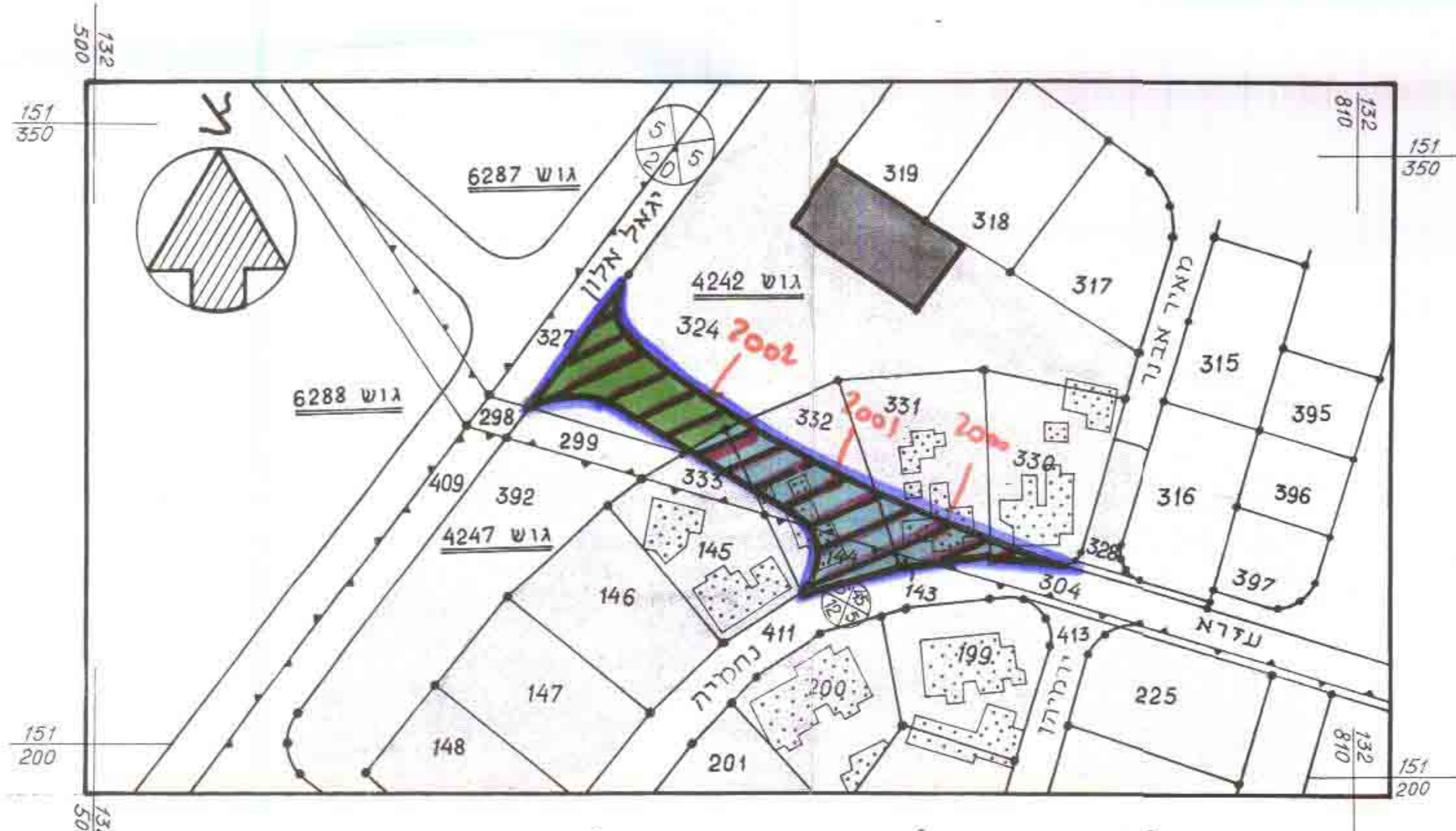
מצב מוצע ק.מ. 1:1250