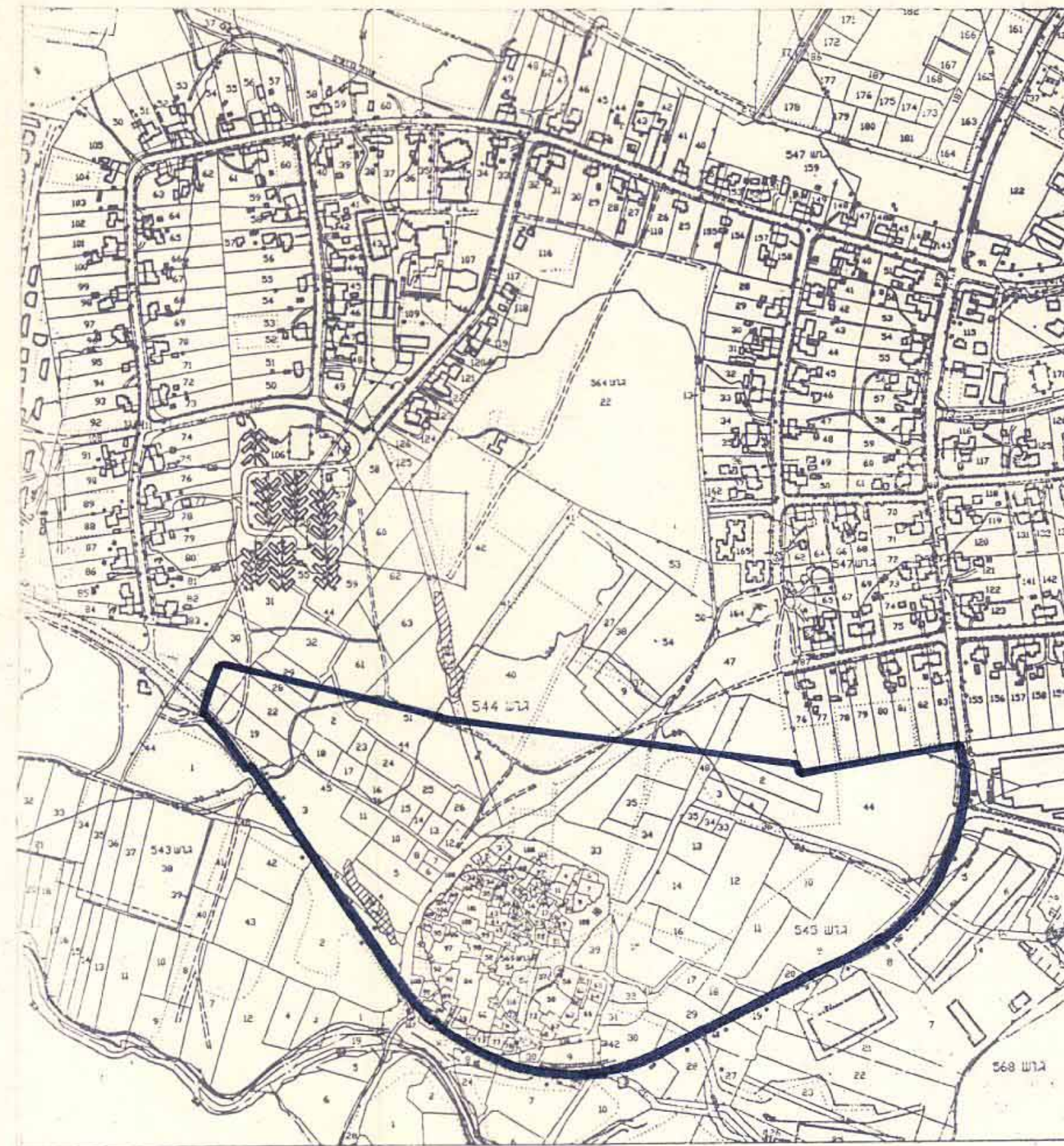
ירושלים סביבה 1:5000