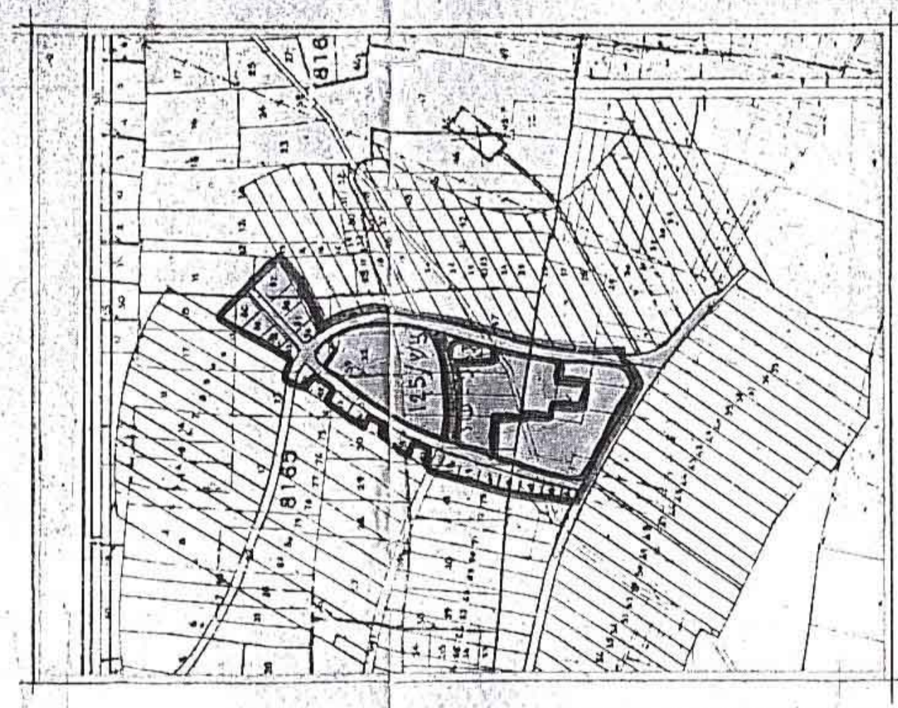
תרשים סביבה ק.צ. 1:10,000 ומפת קיום