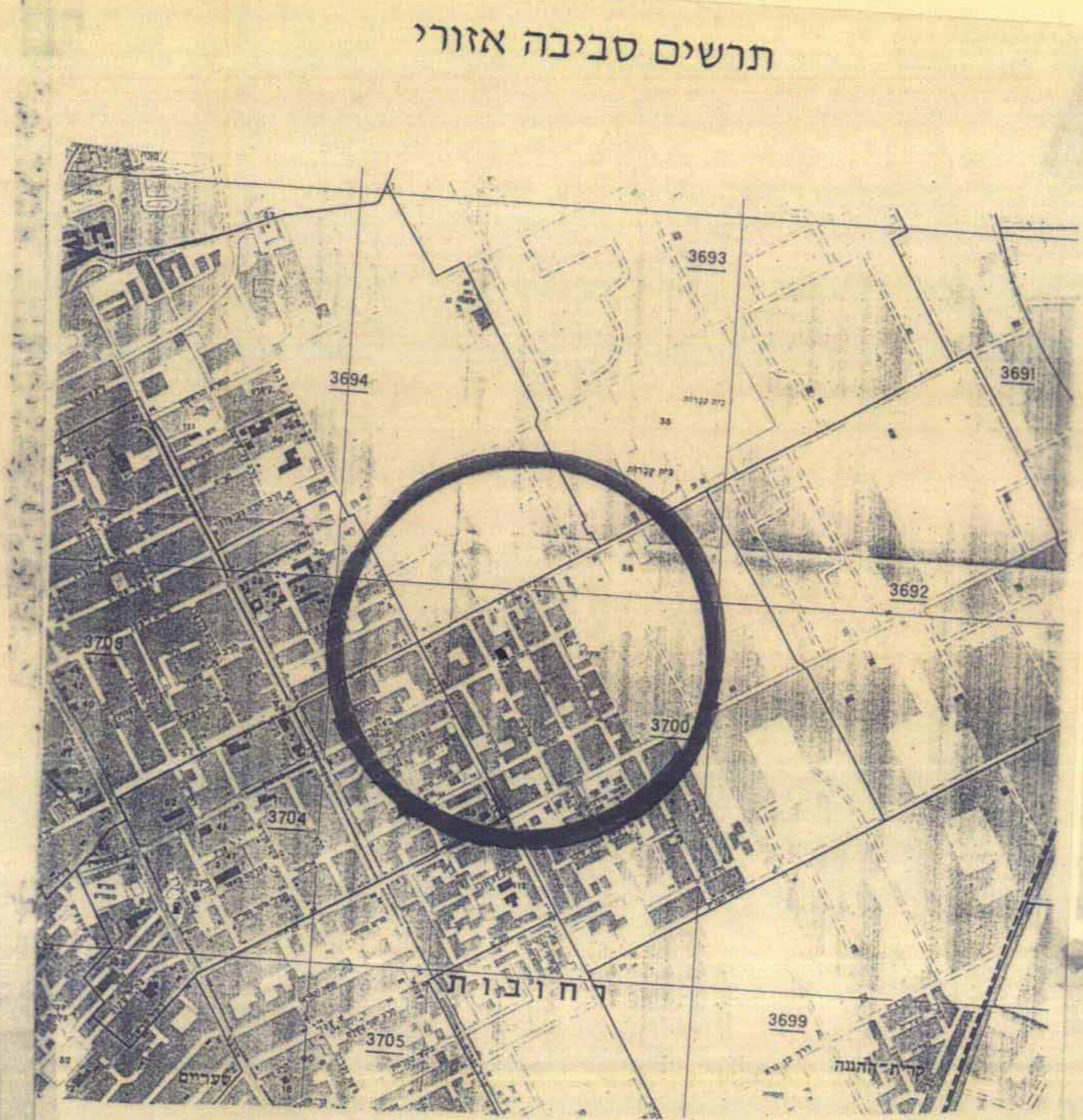
תרשים סביבה אזורי