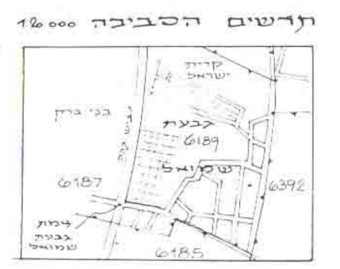
תדשים הסביבה 1:20000