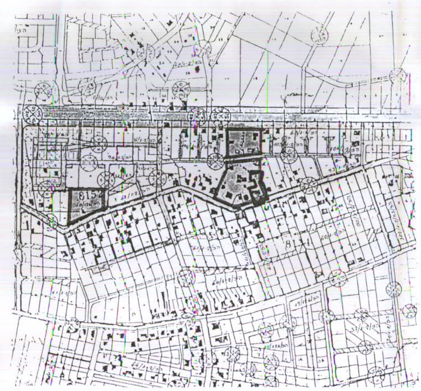
פרטים סביבה ק.מ. 1:5000 ע"פ הב"מ 150