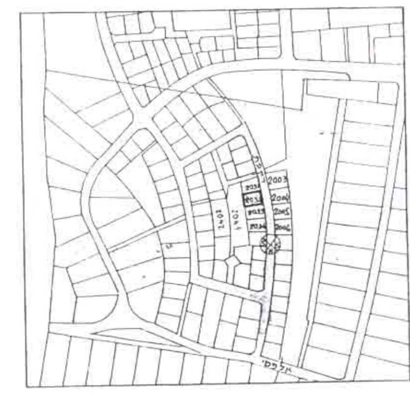
תרשים סביבה 1:5000