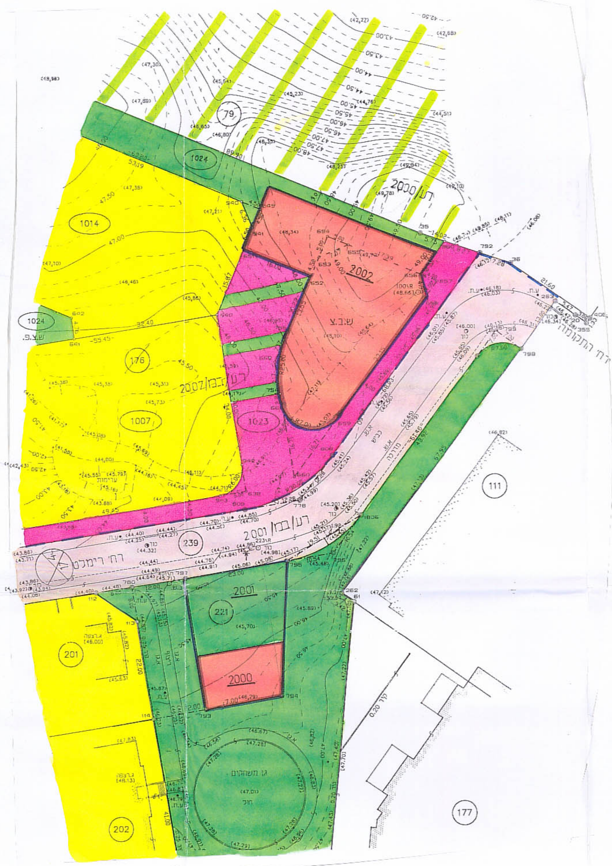
מצב מוצע קנה 1:500

מחוז: המרכז נפה: פתח-תקה מקום: רעננה גוש: 7649 חלקת: 176(חלק), 221 שטח התכנית: 1776 מ"ר היום: הועדה המקומית לתכנון ובנייה, רעננה. המתכנן: מחד הנדסה, רעננה. בעלי הקרקע: עיריית רעננה קנה: 1:500, 1:5000