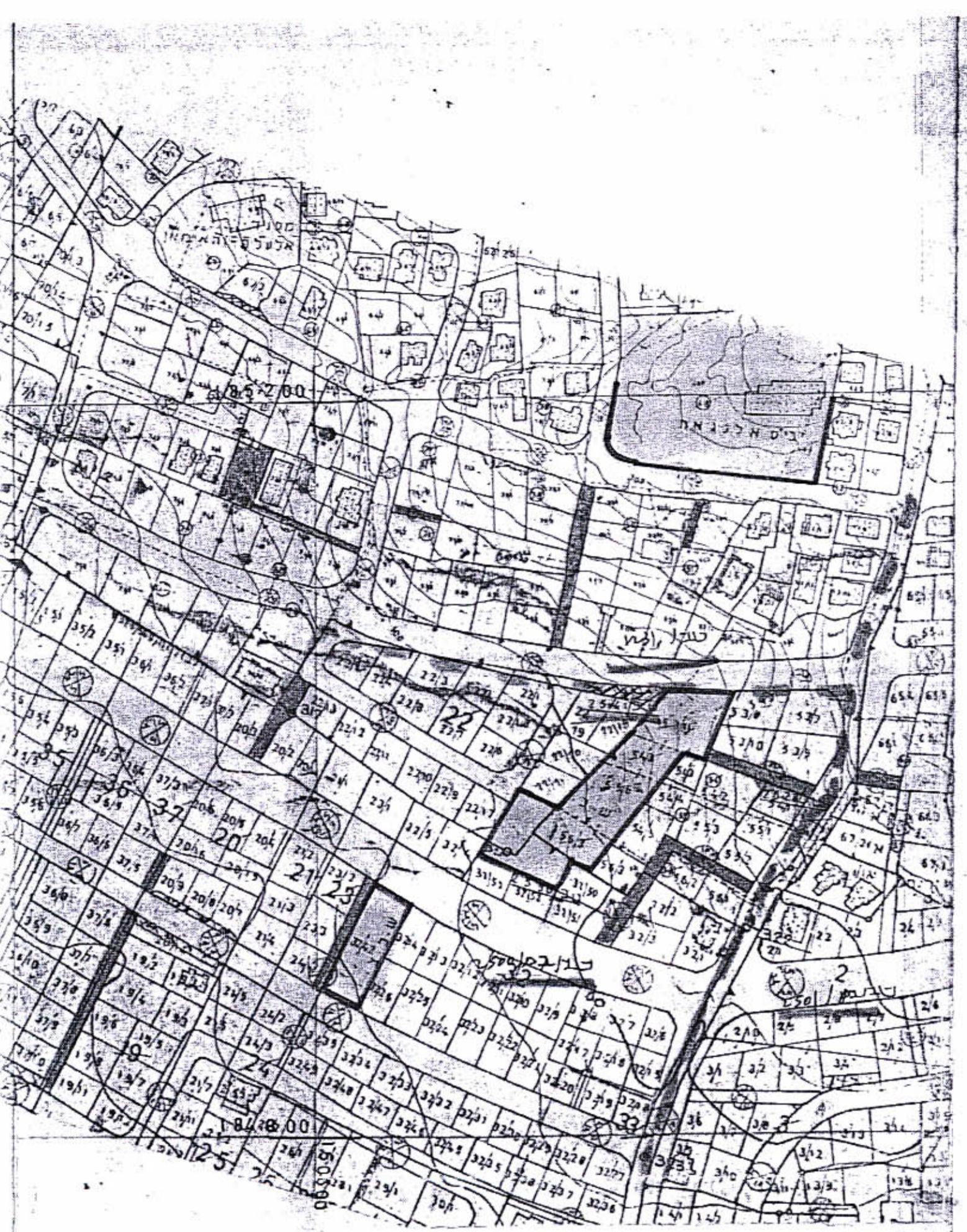
תרשים סביבה ק"מ 1:2500