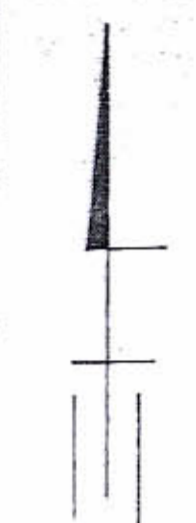
מצב מוצע ק"מ 1:250