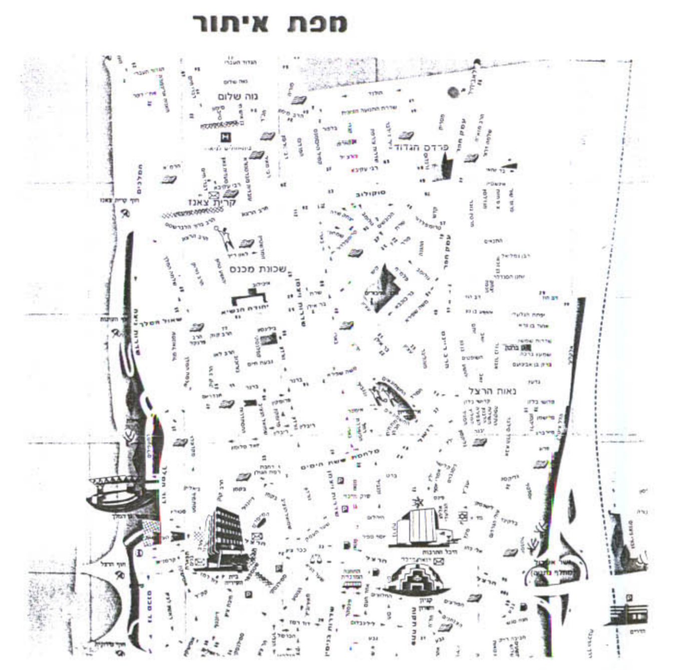
תרשים הסביבה ק.מ.2500:1