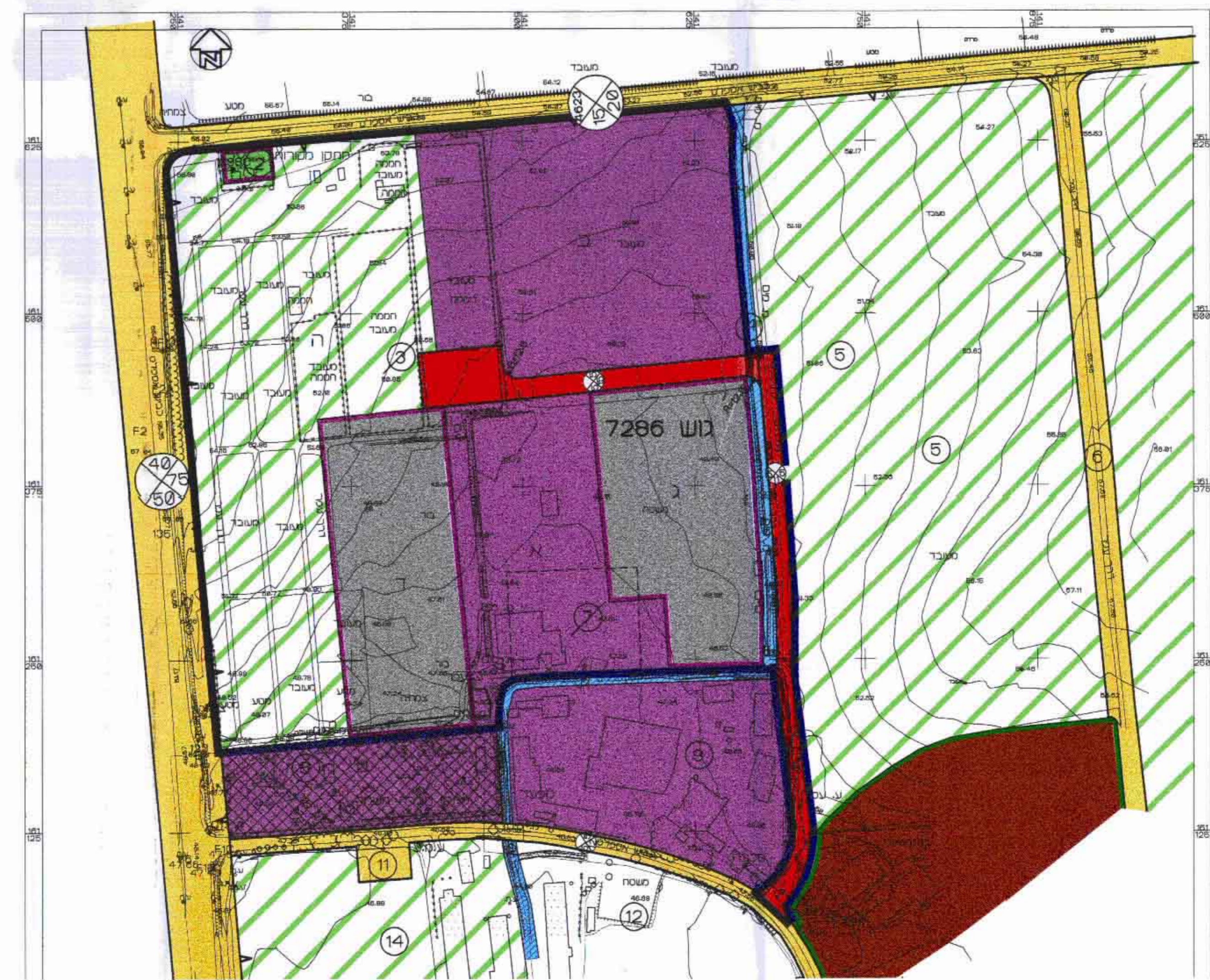
תכנית מצב מוצע ק"מ 1:2500