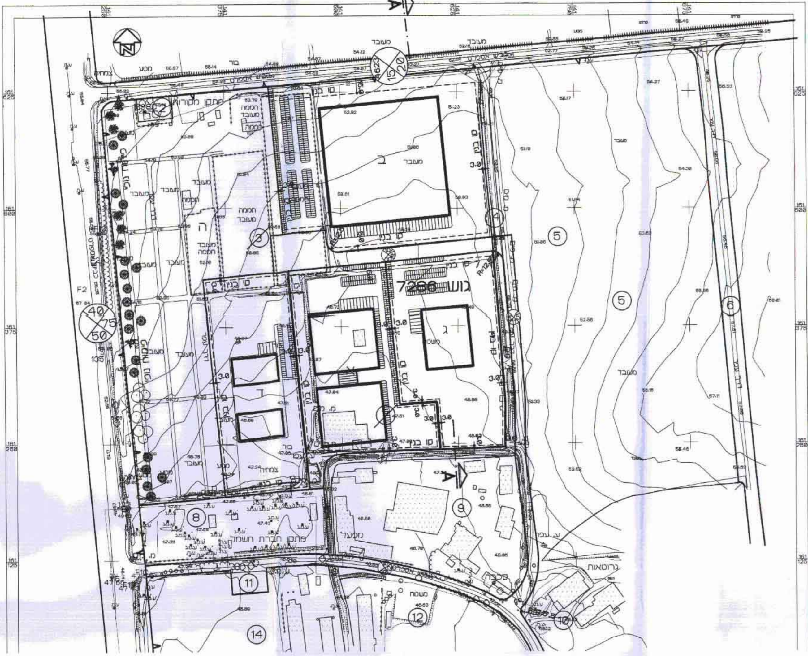
תכנית ביזעי עקרונית ק"מ 1:2500