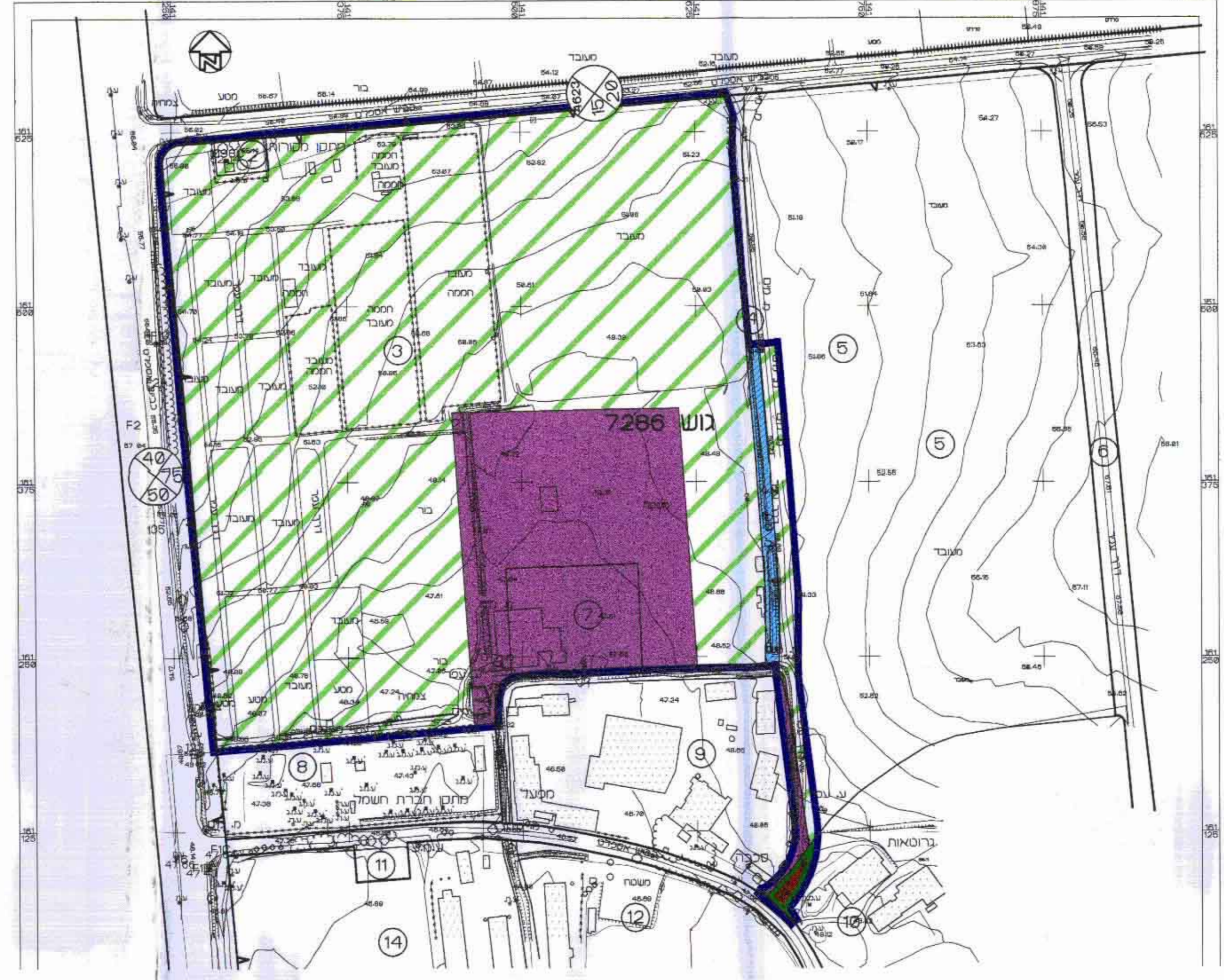
תכנית מצב קיים ק"מ 1:2500