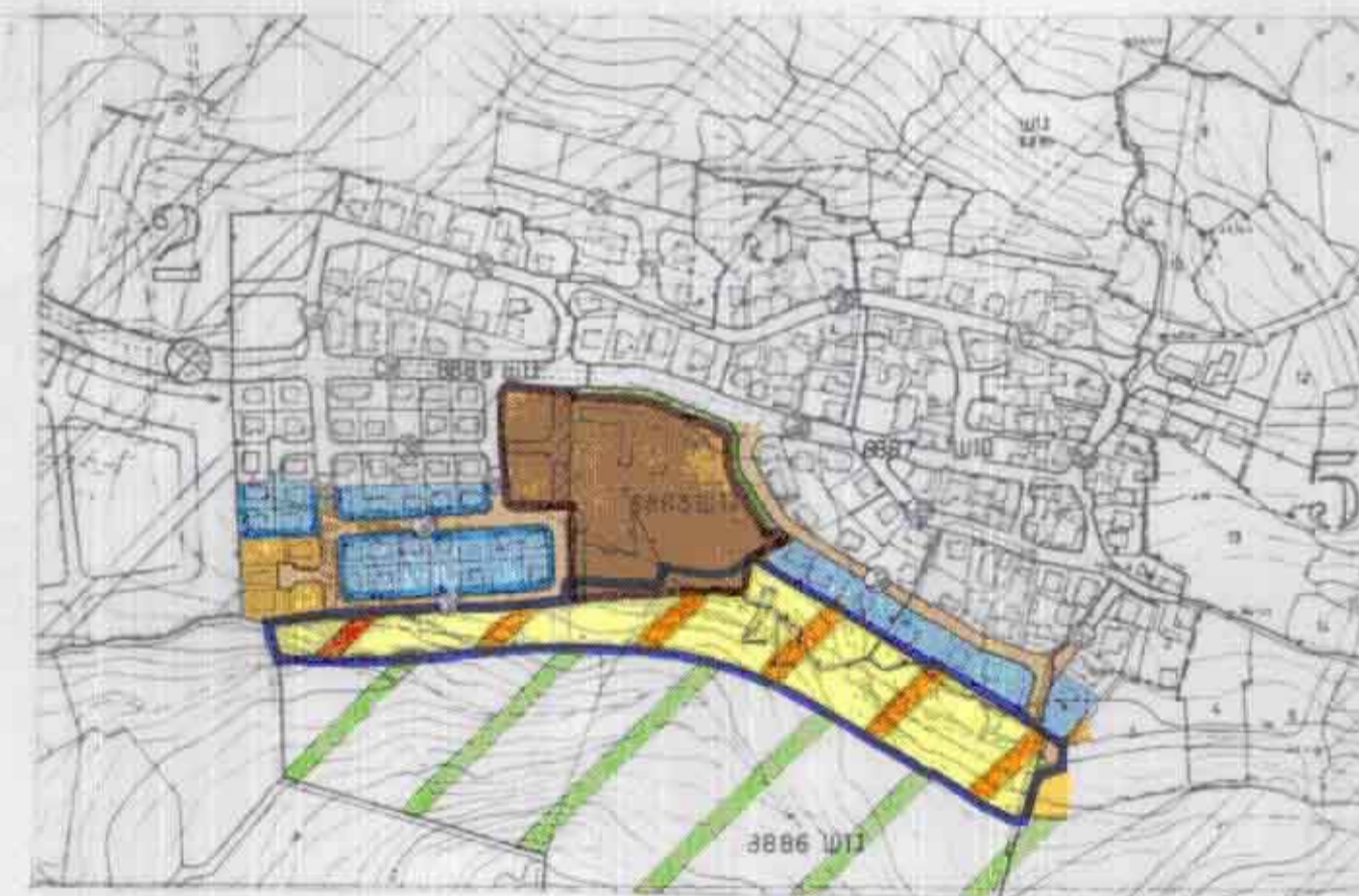
תרחים סביבה 1:5000