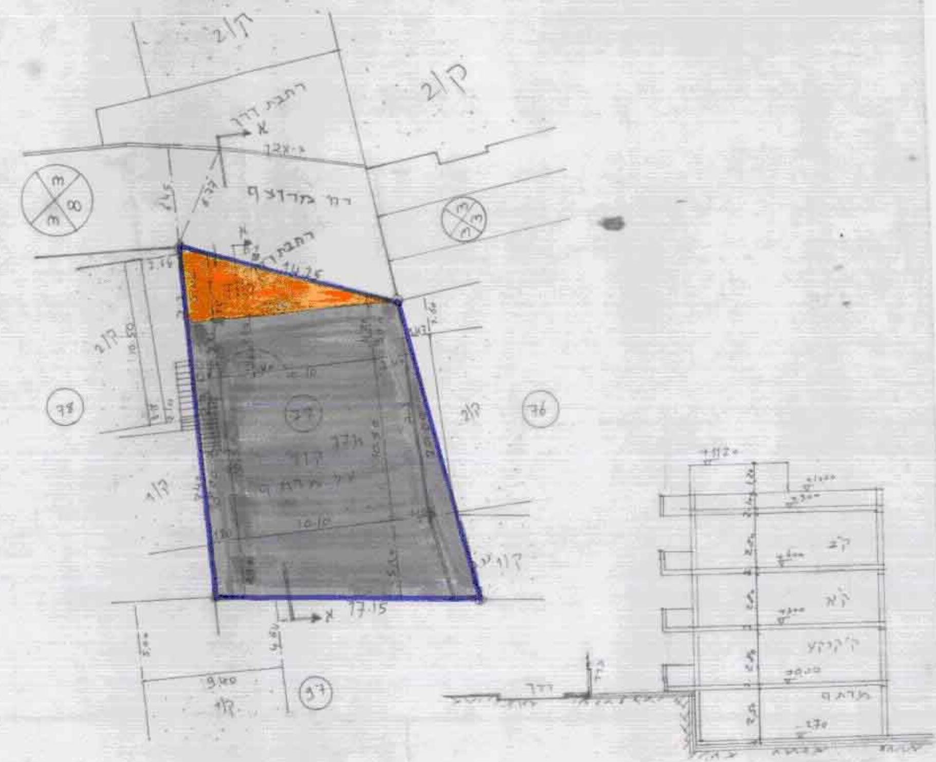
מצב מוצע 1:250