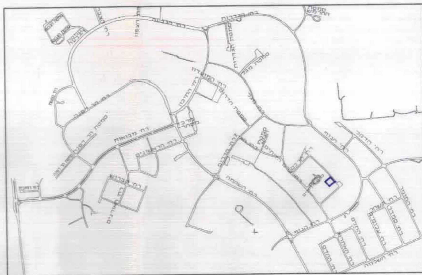
תרשים סביבה ק.מ. 1:10000

היזם: _____ המתכנן: _____ מועצה מקומית: _____