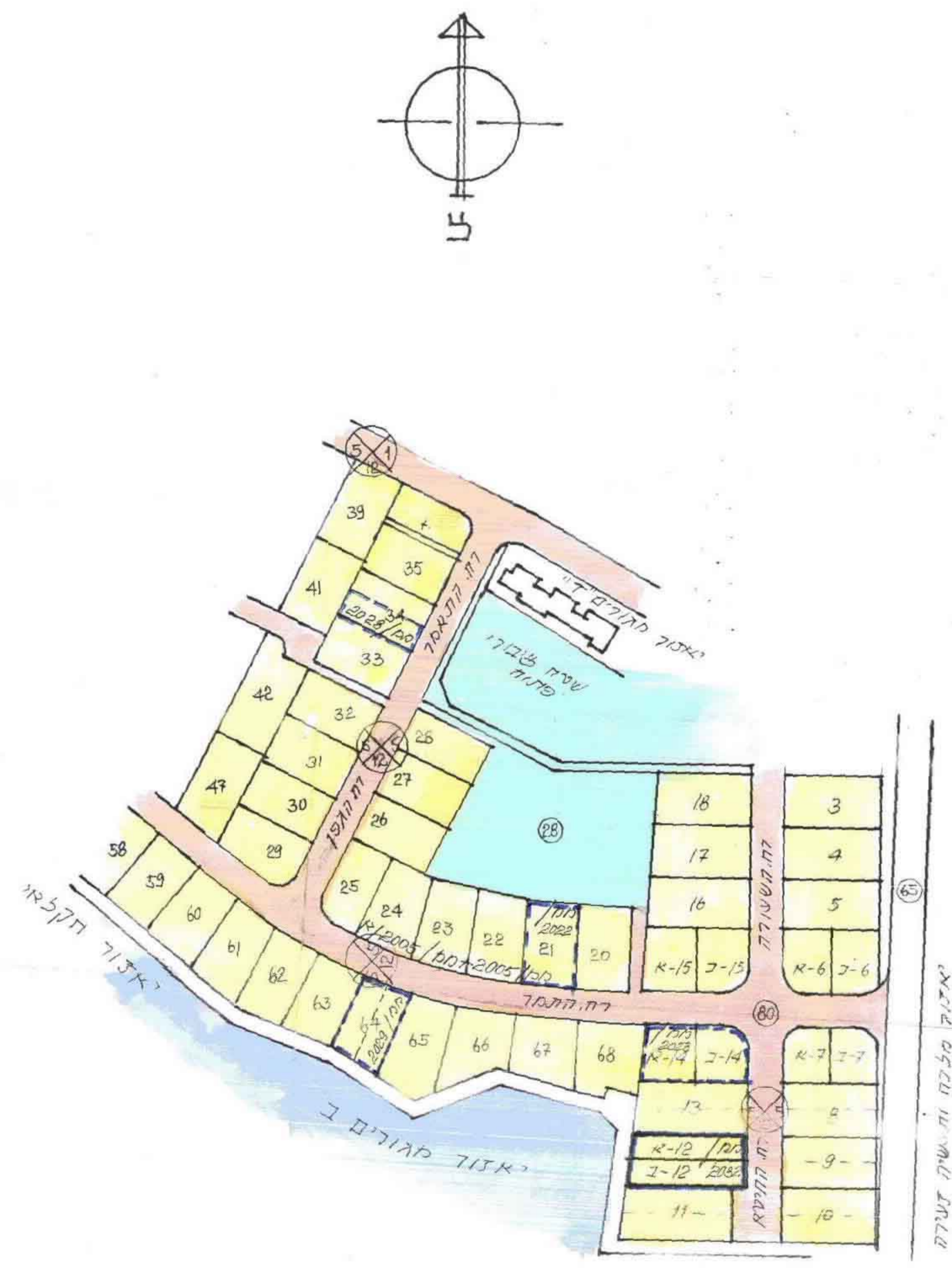
מצב קיים קמ" 1:1250 על השטח הצבוע חלות