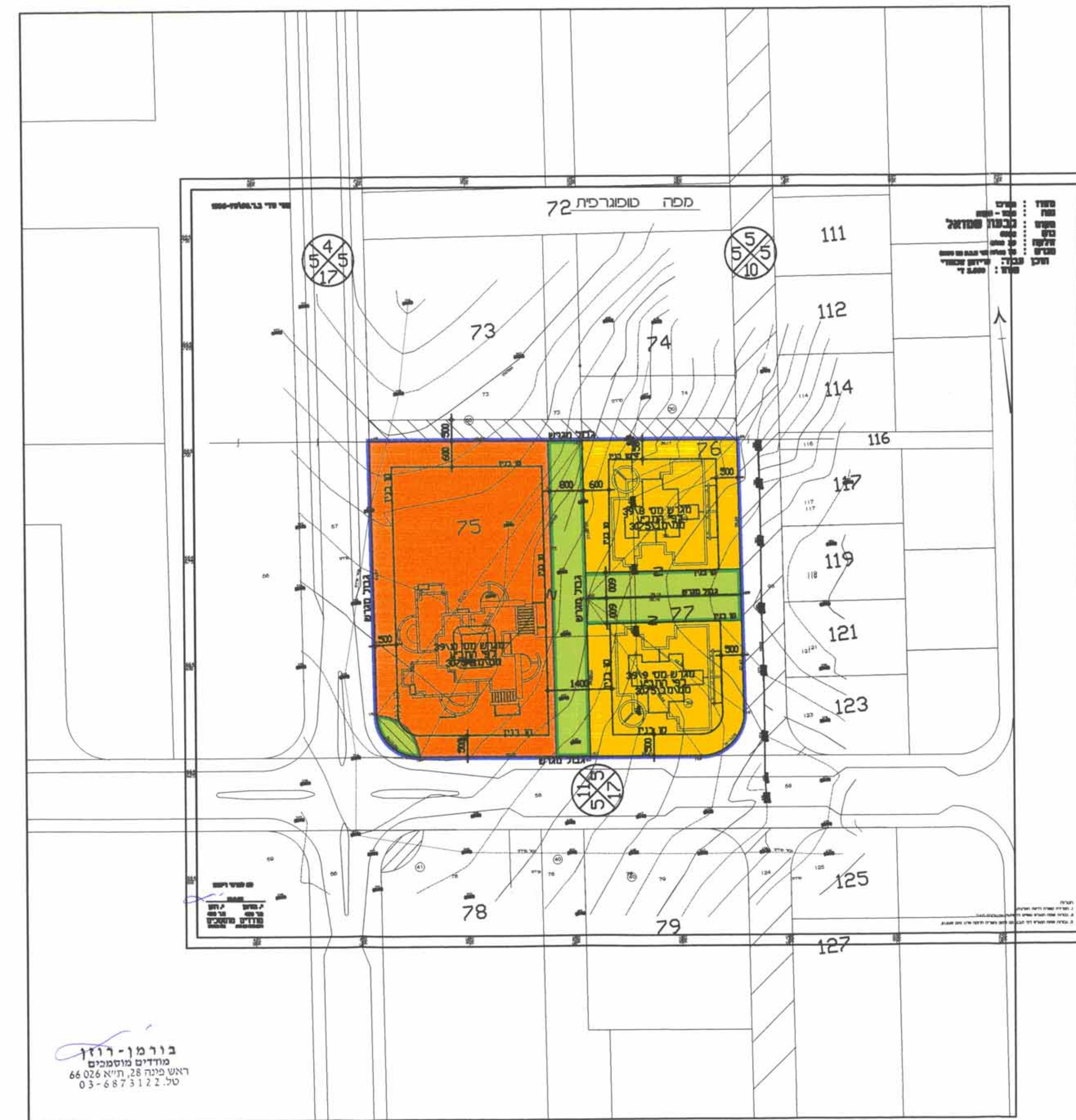
מצב מוצע קו"מ 1:750

בורמן-רזון מודדים נוטסמכים רש"ט מ"מ 28, ת"א 66 026 טל: 03-6875122