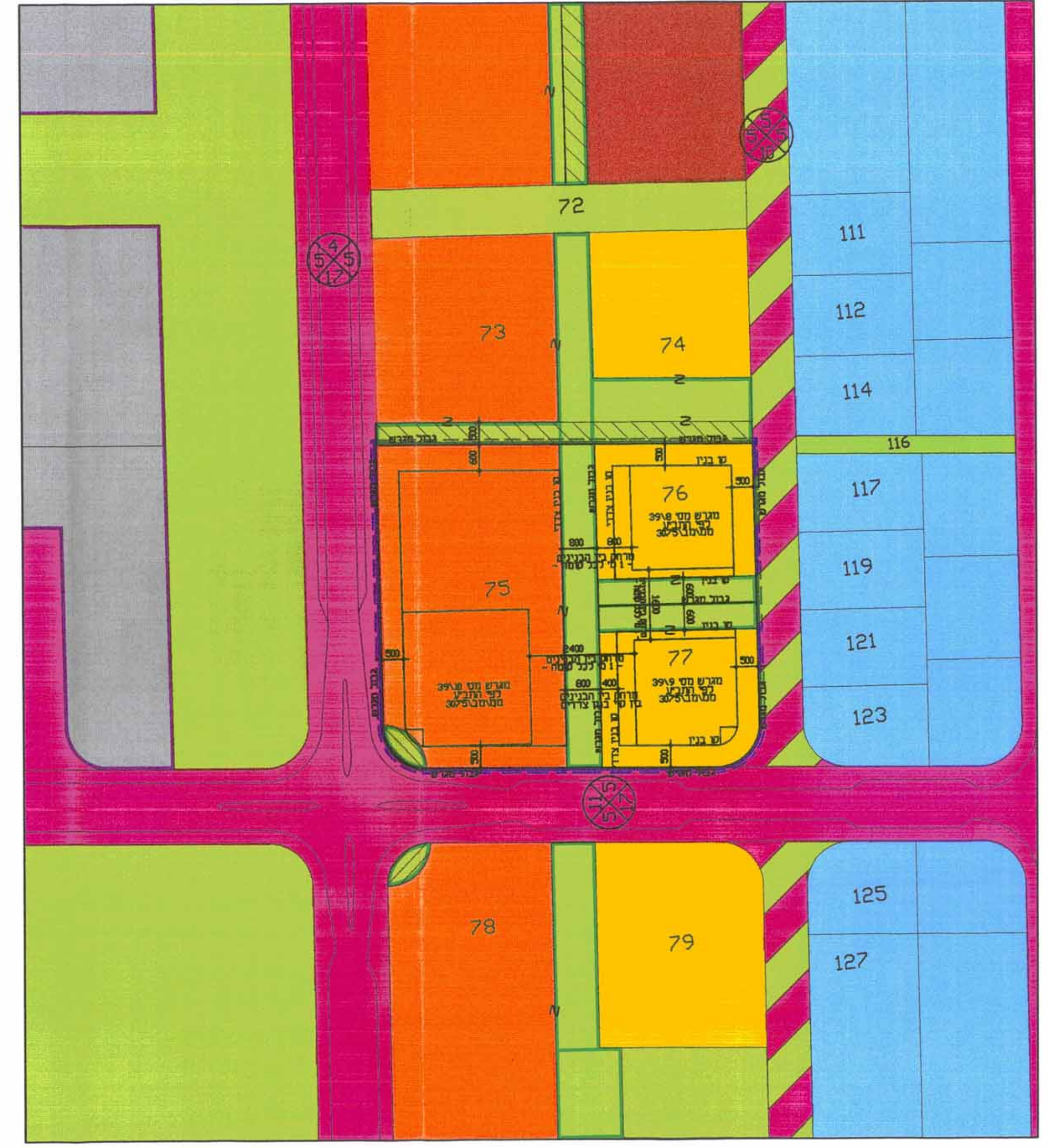
מצב קיים 1:750