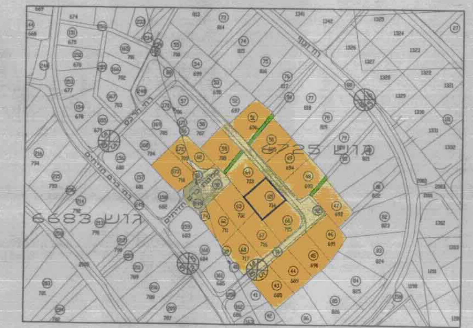
מצב קיים ק.מ. 1:2500