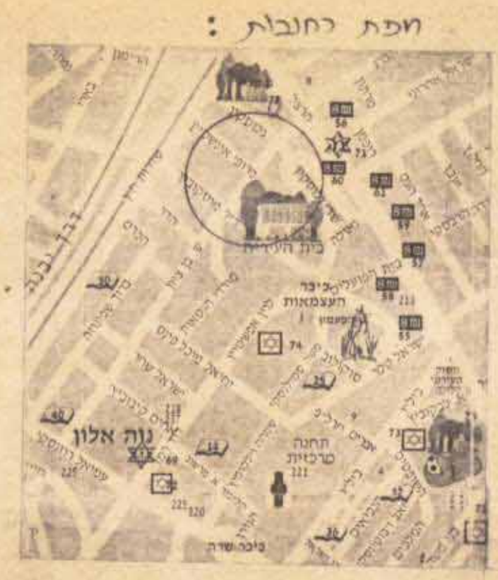
תושיע סכימה קנה: 1:2500

חתימת היוזם חתימת בעל הקרקע חתימת המתכנן תאריך