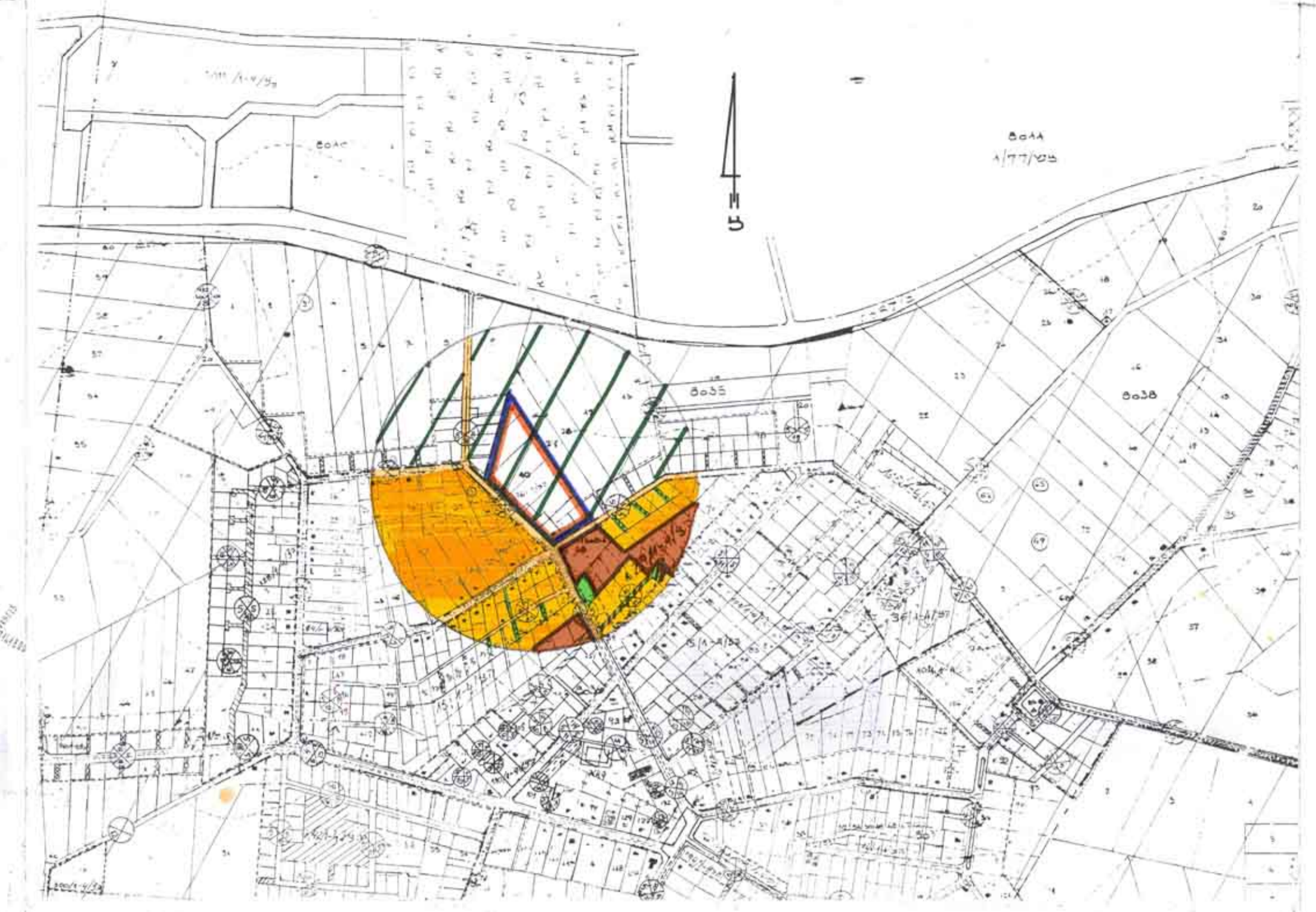
תרשים סביבה ק.מ. 1:5000 בהתאם להצ/130 ולהצ/76/1-4

נפת השרון מועצה מקומית קדימה גוש: 8035 חלקה: 10 שטח התכנית: 20,264 מ"ר קנה מידה: 1:500-1:5000 היזום: ועדה מקומית לתכנון ולבניה שרונים ומיכאל נתנון מגיש התכנית: מיכאל נתנון בעל הקרקע: מיכאל נתנון ת.ז. 250849 רח' ביאליק-קדימה המתכנן: ירי גולדנברג-אדריכלות ובינוי ערים רחוב הסיף 27 רמת השרון, טל: 03-5492432 חתימות: