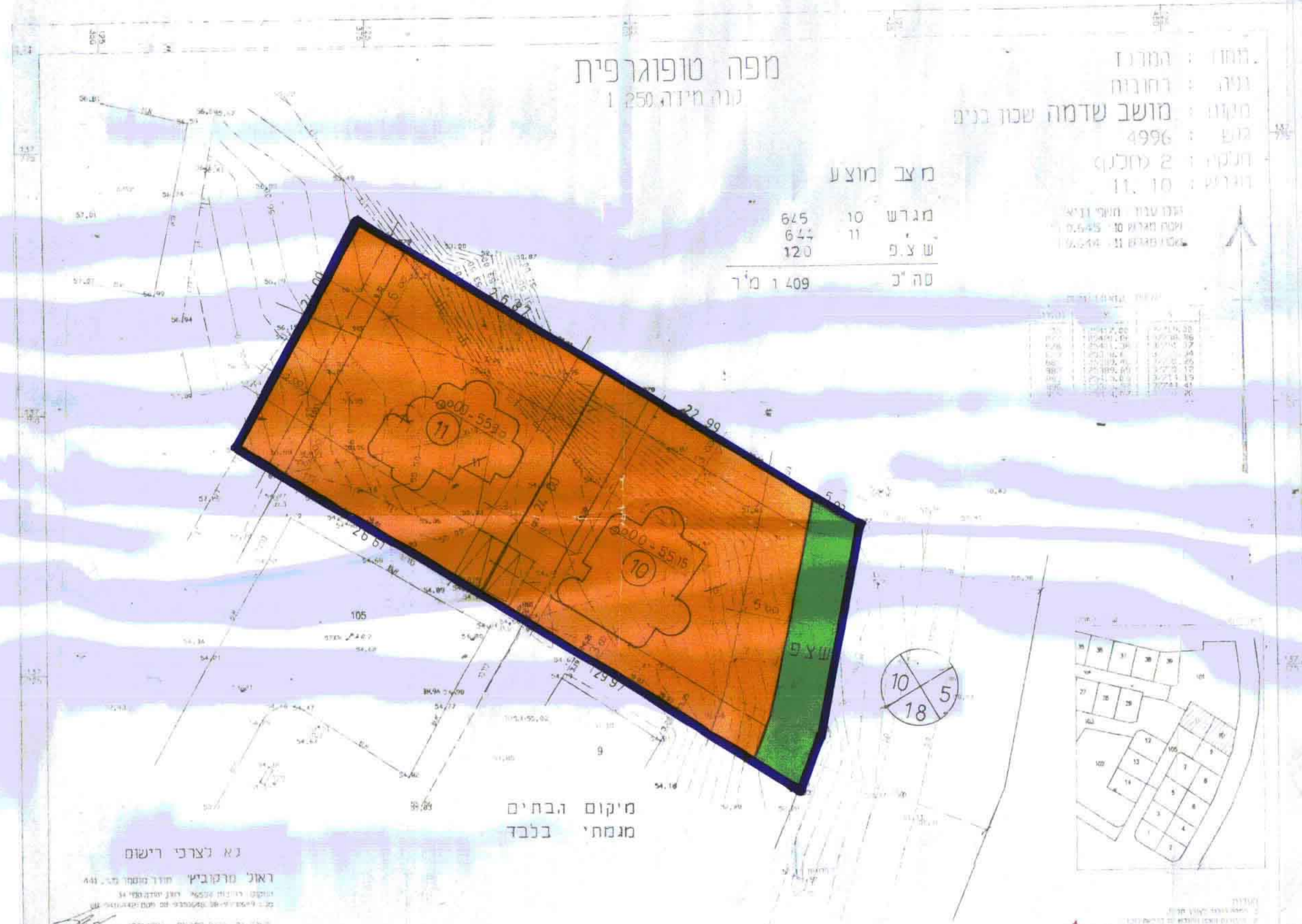
מצב מוצע 1:250

לא יצרני רישום ראול מרדכיץ תאריך: 20.01.96