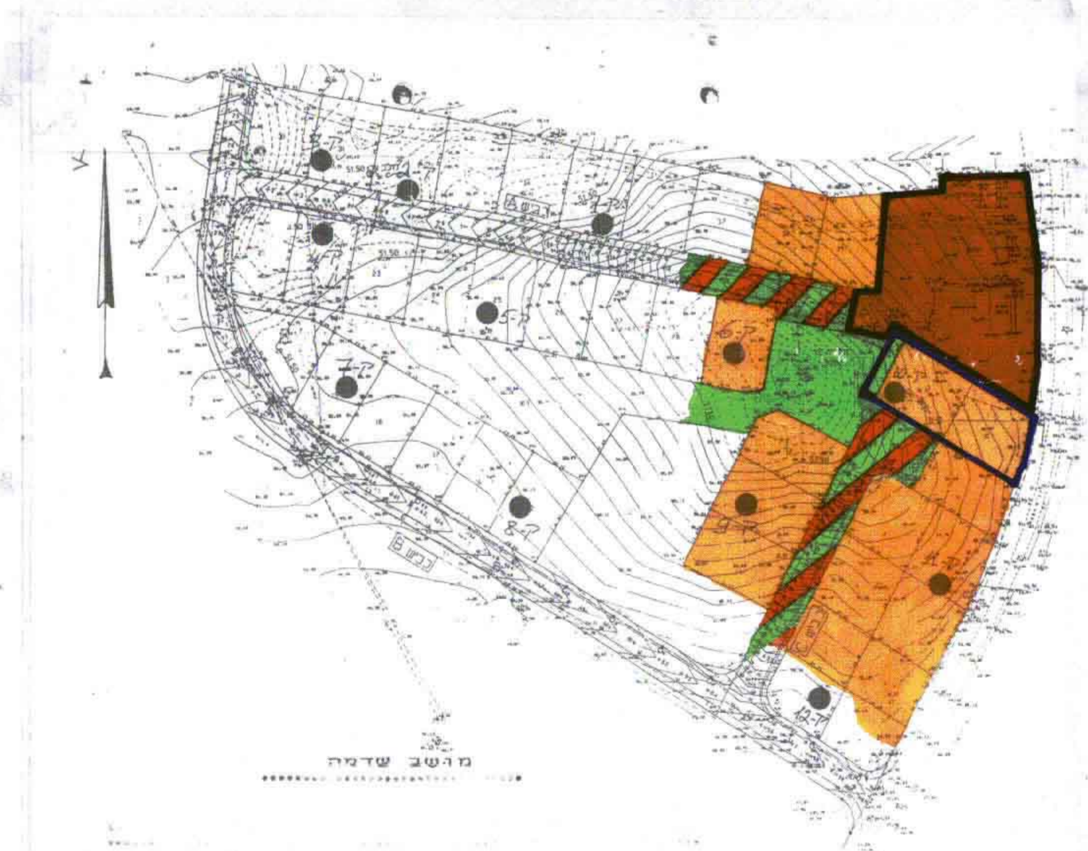
תרשים הסביבה 1:1250

מחוז: המרכז גוש: 4996 חלקה: 2 (חלק) מרחב תכנון: מקומי "שורקות" תוכנית: שינוי מתאר חט' בר/מק/4/158