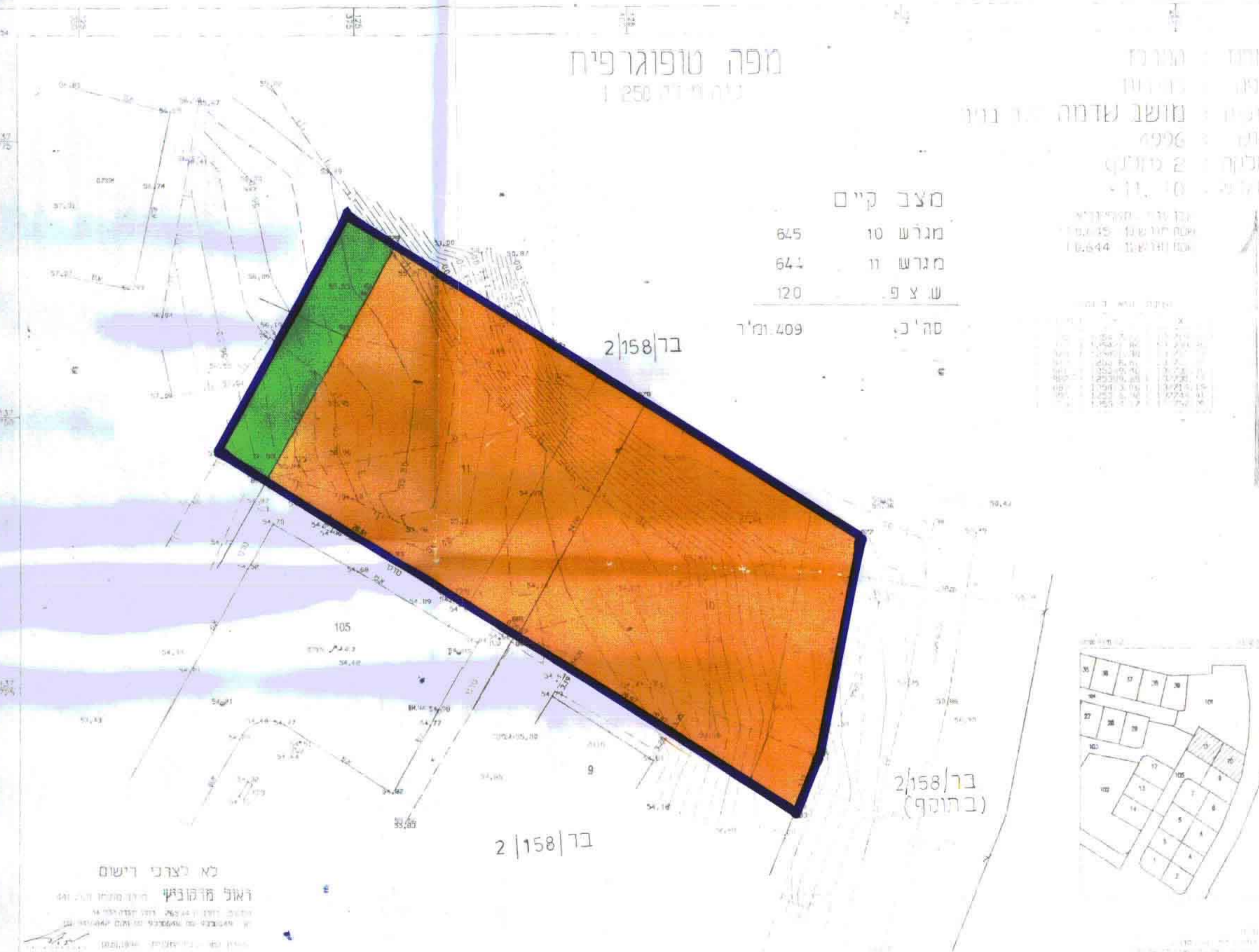
מצב קיים 1:250

מחוז: המרכז גוש: 4996 חלקה: 2 (חלק) מרחב תכנון: מקומי "שורקות" תוכנית: שינוי מתאר חט' בר/מק/4/158