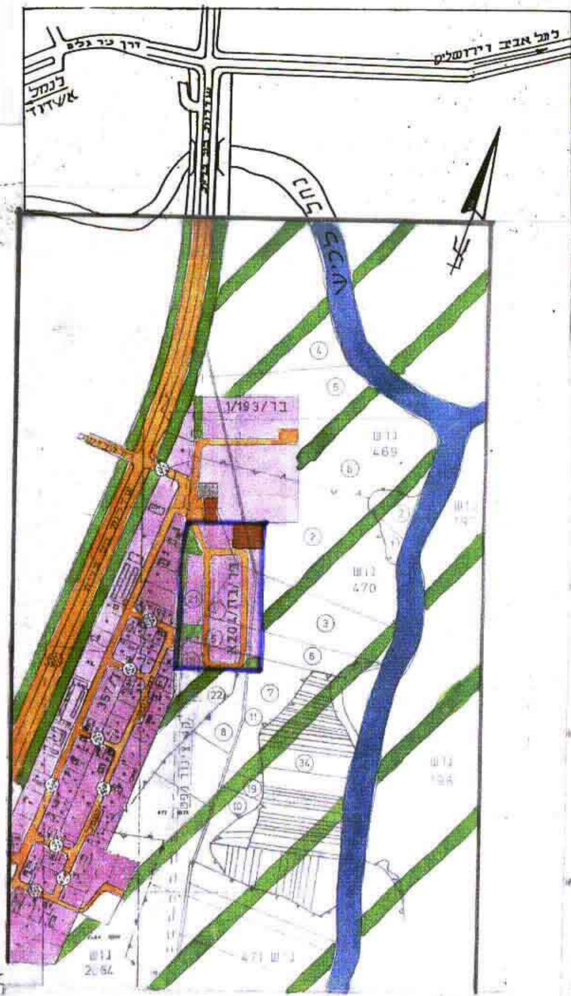
תושים הסביבה - 10,000