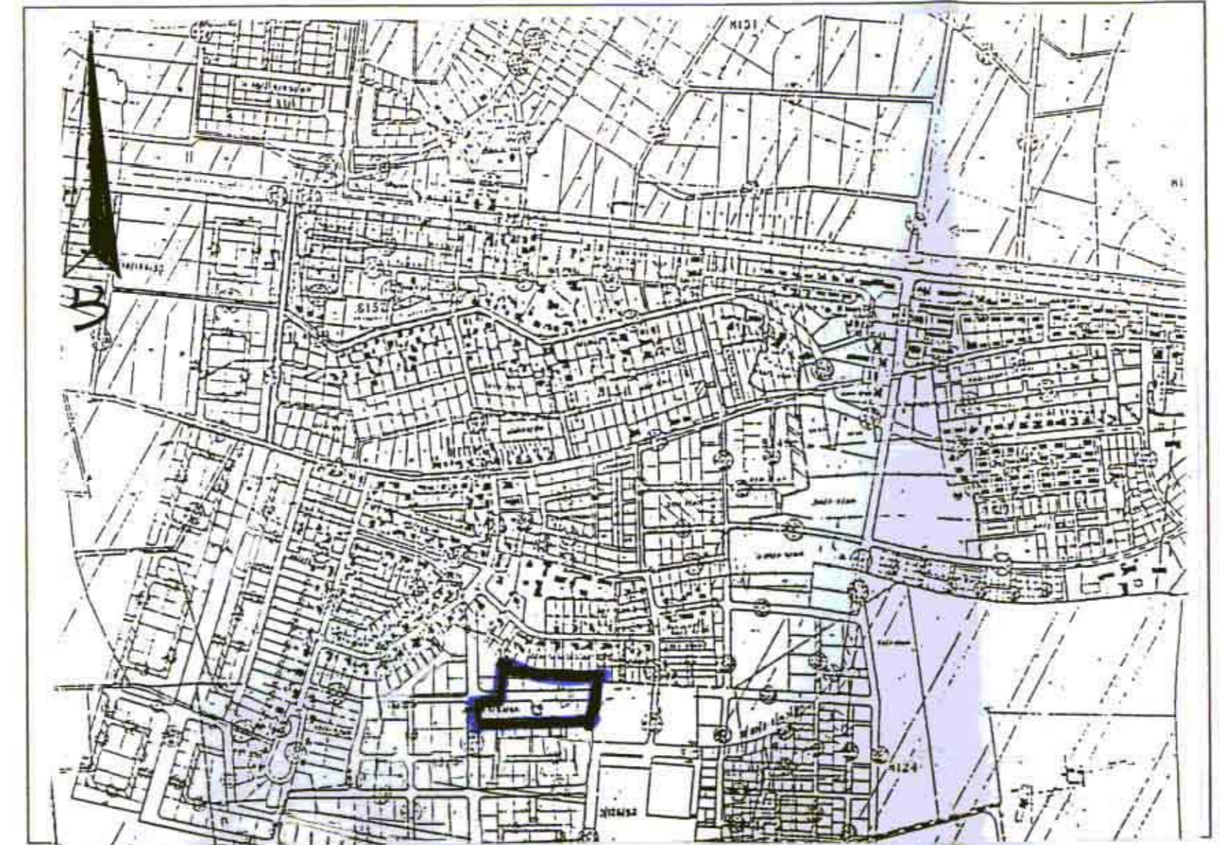
תרשים סביבה ק.מ. 1:100000