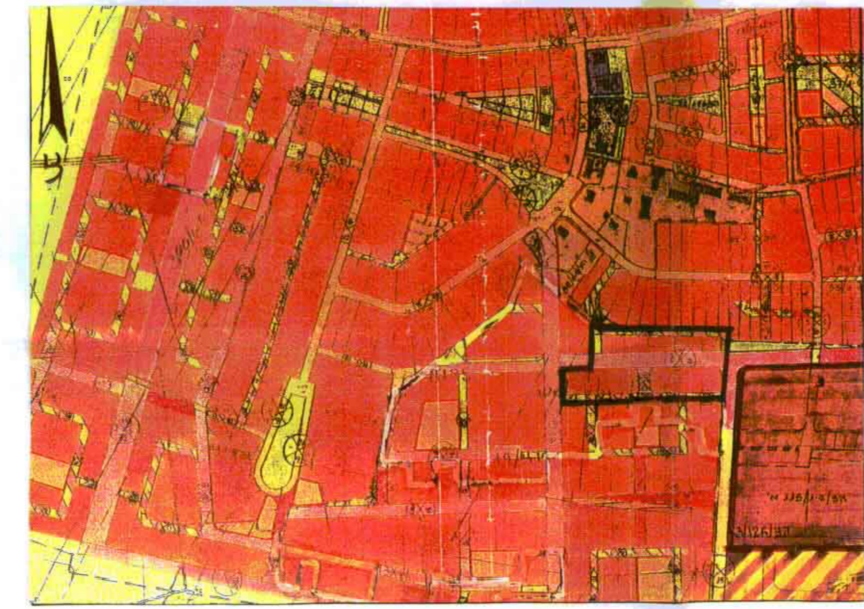
תרשים סביבה ק.מ. 1:50000

מחוז : המרכז נפה : השרון מקום : כפר יונה גוש : 8125 חלקות : 6-9 הוכן עבור : שכון עובדים אליאב