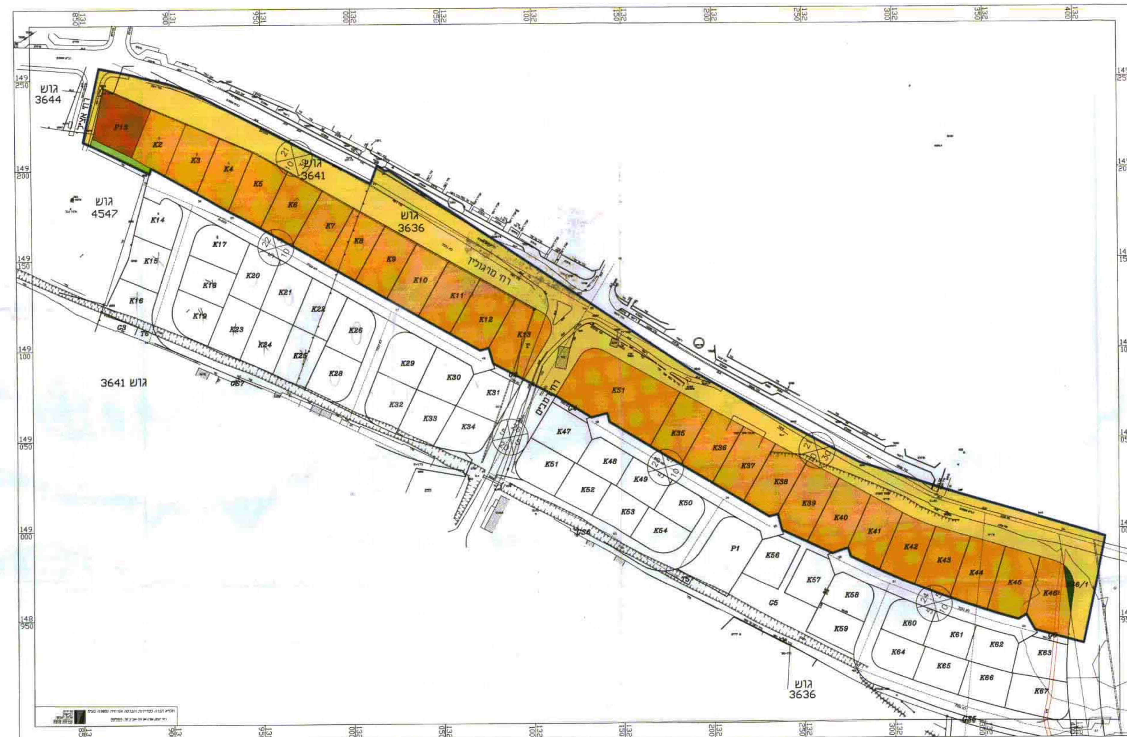
מצב מוצע 1:1250