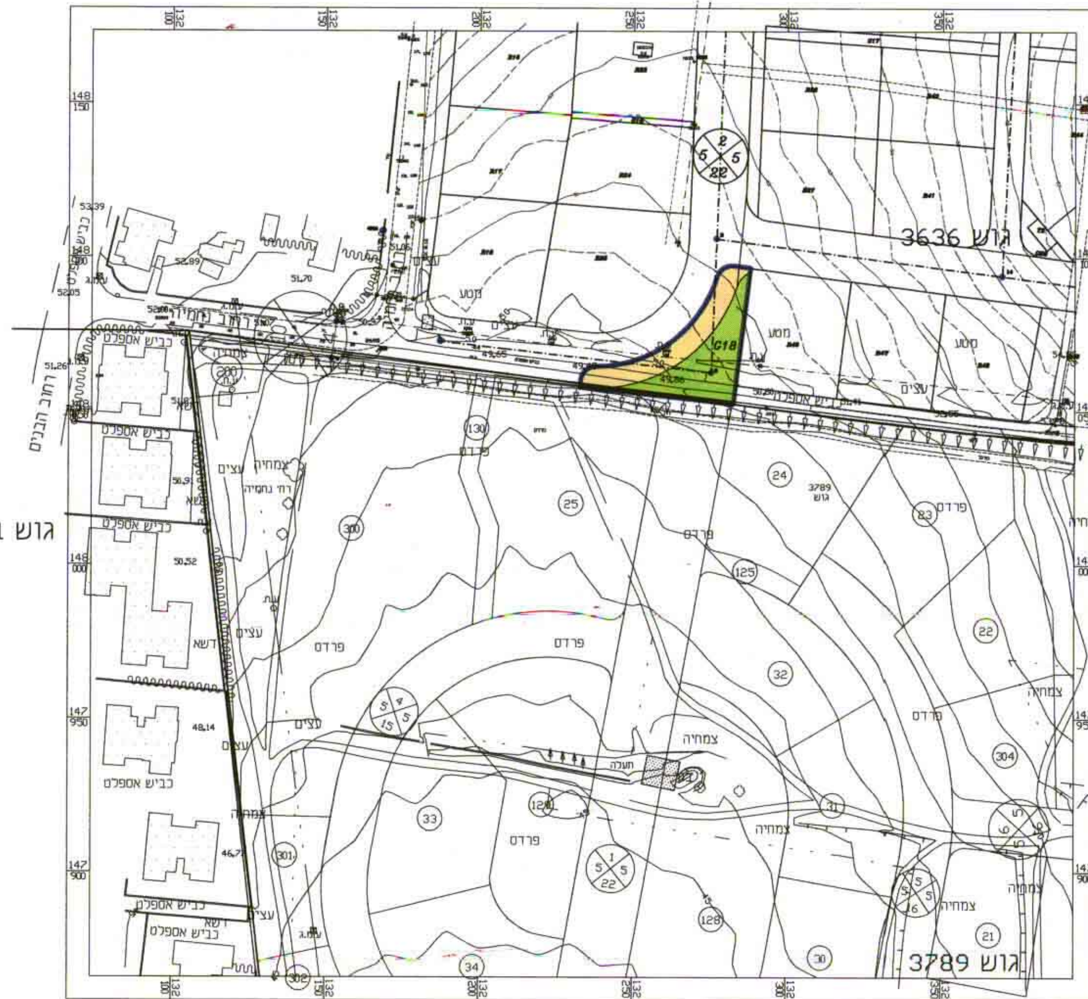
מצב קיים 1:1250