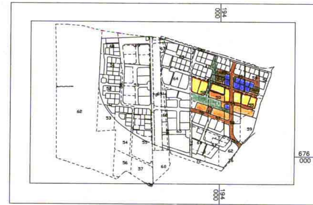
תרשים סביבה ק.ה. 1:1000 לפי תוכנית מתאר כטבמ2

מחוז מרכז מרחב תכנון מקומי כפר-סבא תכנית שינוי מתאר מס. כטמקטבמ2\ד שינוי לתכנית מתאר כטבמ2