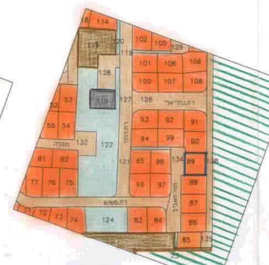
תרשים סביבה קני"מ 12500