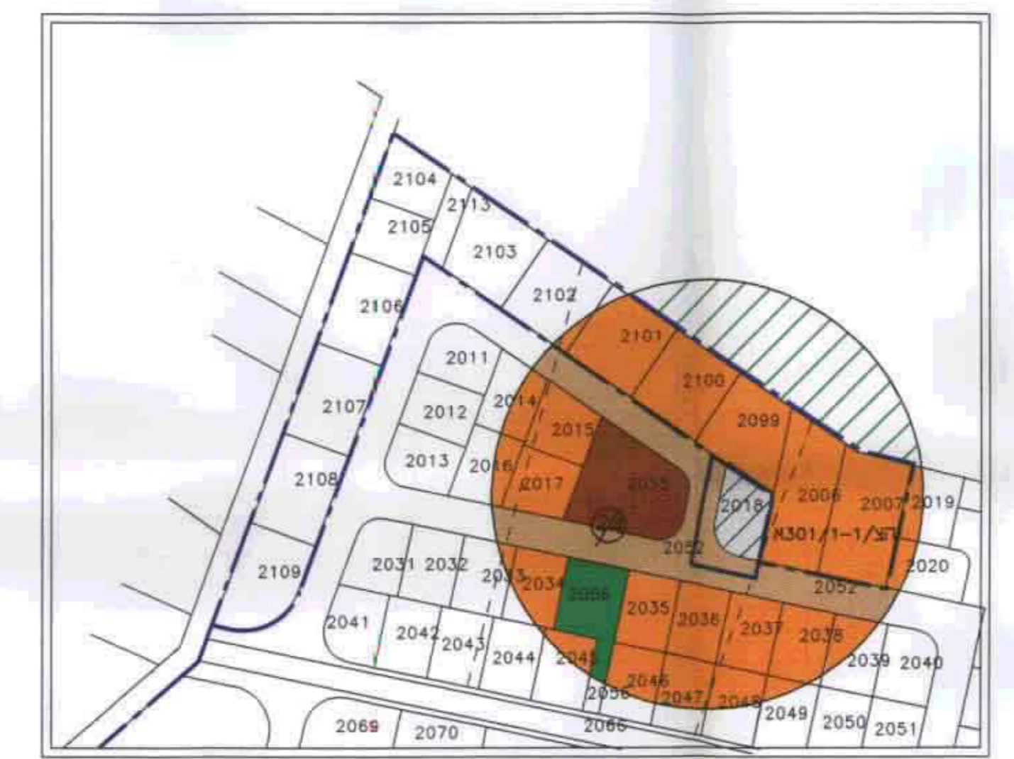
תרשים סביבה ק.מ. 1:2000 לפי הצ/במ/1-1/301 והצ/1-1/301א

מקום : אבן יהודה מחוז : מרכז נפה : השרון גוש : 8013 חלקה : 24 מגרש : 2018 שטח : 0.450 (ד.מ.) הוכן עבור : אהרון ברנר