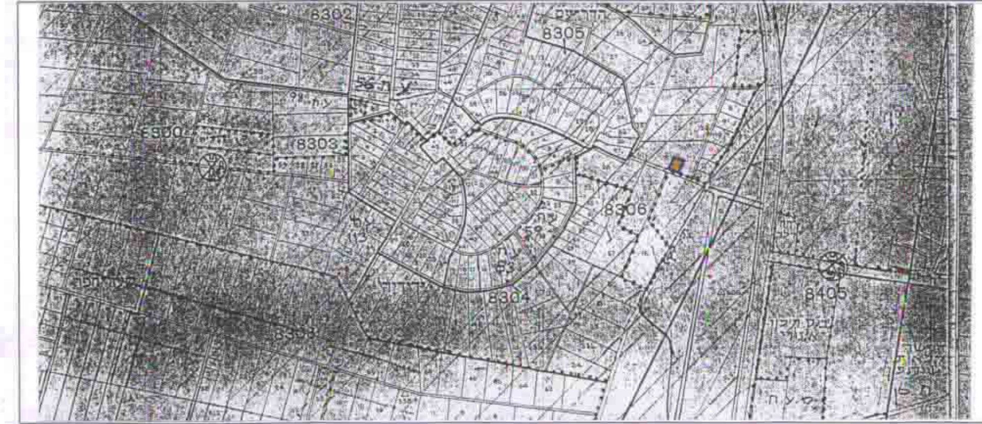
תרשים מיקום קנימ 1:10000 לפי עח\200