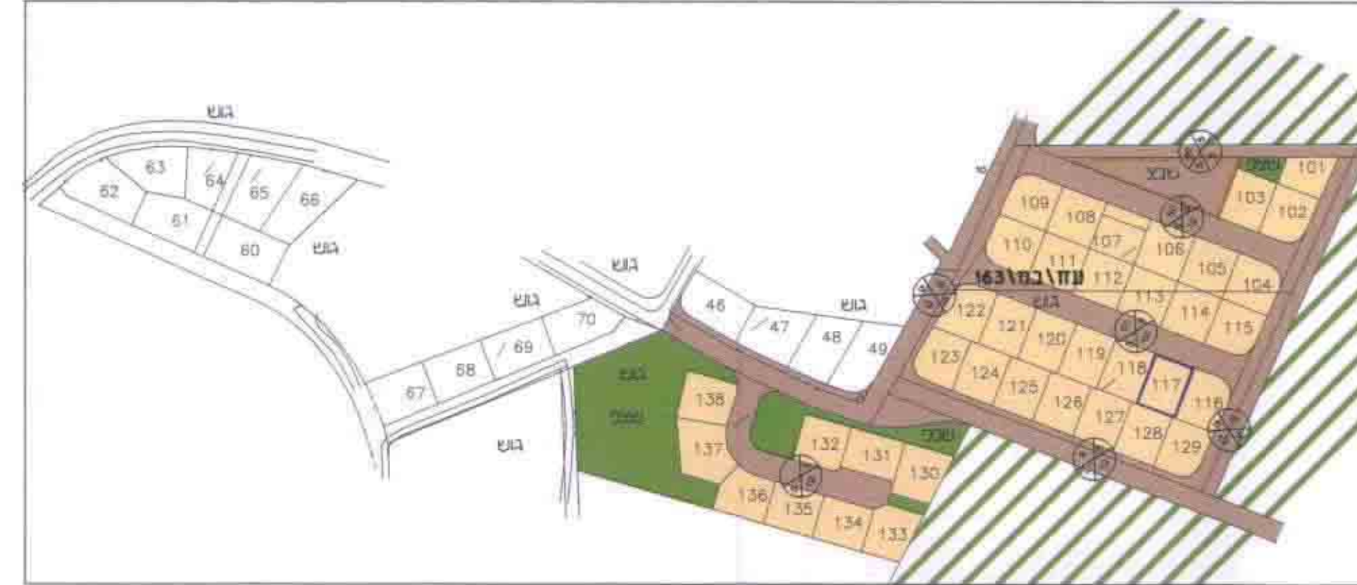
תרשים סביבה קנימ 1:2500 לפי עח\במ\163