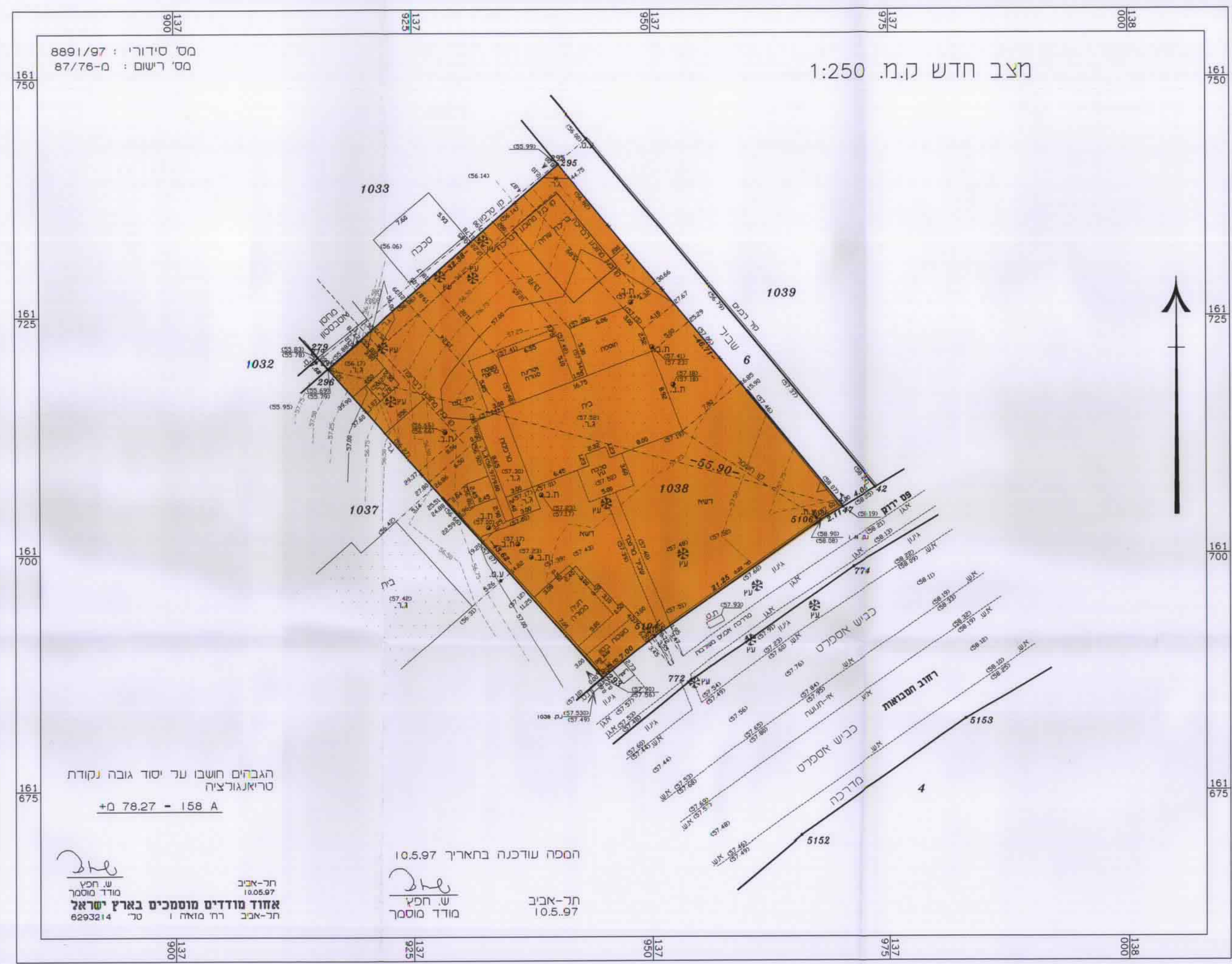
מצב חדש ק.מ. 1:250